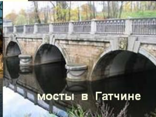
мосты в Гатчине