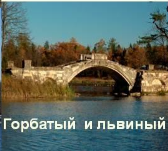
Горбатый и львиный