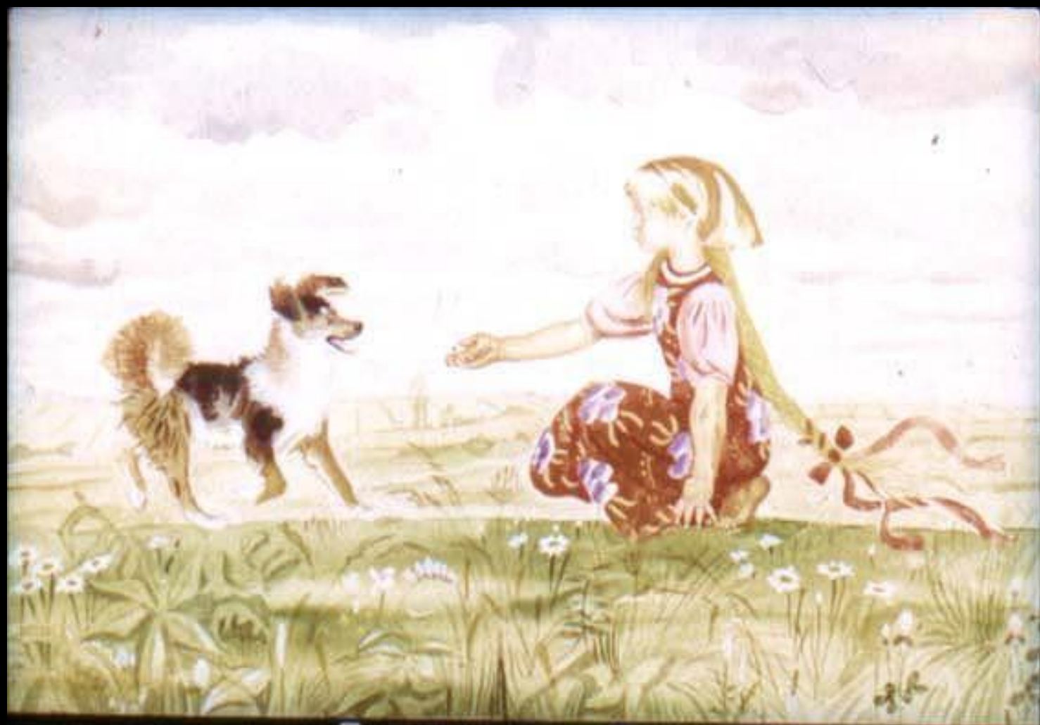
Позвала внучка Жучку.