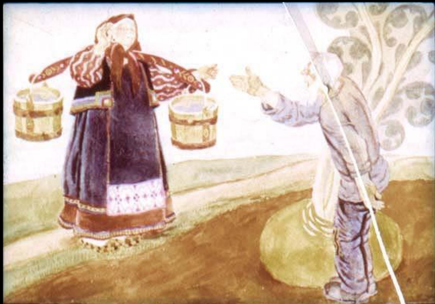
Позвал дед бабку.