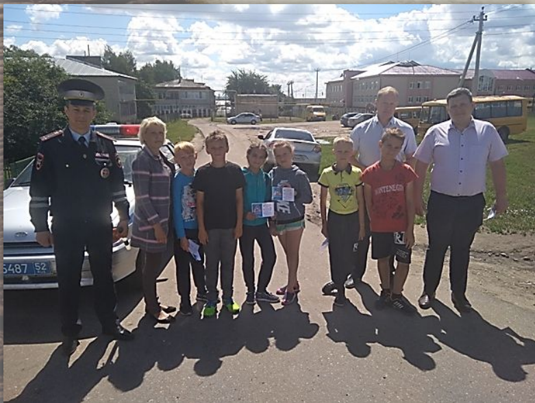
Профилактическая акция «Автокресло детям!» с. Гагино