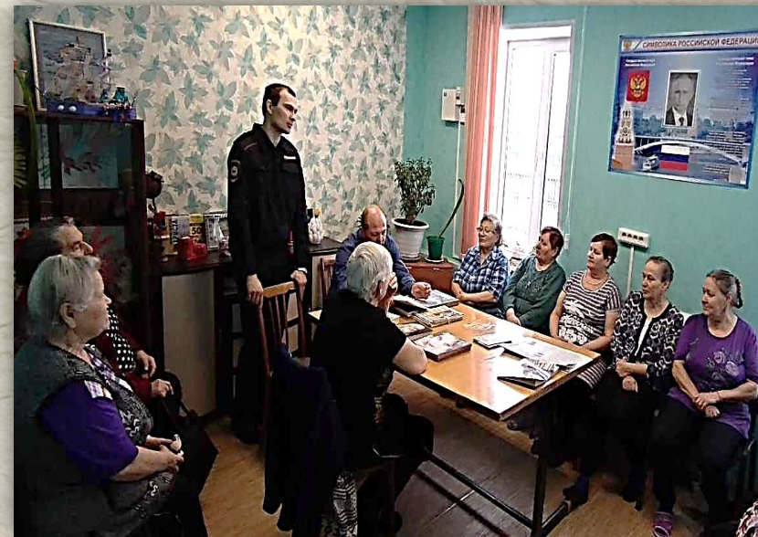
Профилактическая беседа «Как не стать жертвой мошенников»