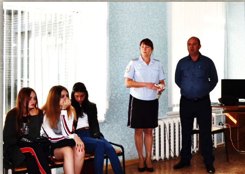
Профилактическая беседа «Скажем «Нет!» терроризму»