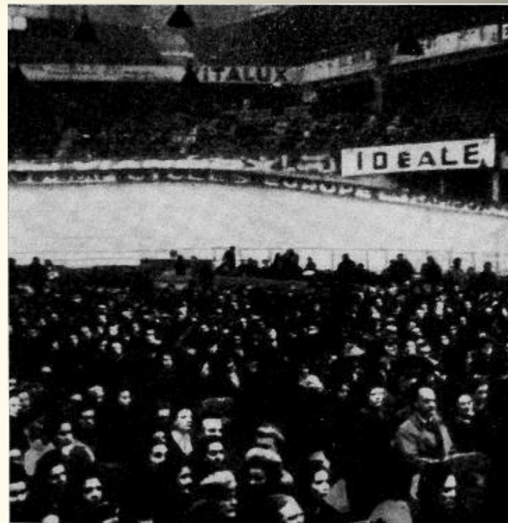
Конгресс женщин. Париж. 1949 г.

После Второй мировой войны, когда проблемы сохранения здоровья и благополучия детей были как никогда актуальны, в 1949 году в Париже состоялся конгресс женщин, на котором прозвучала клятва о безустанной борьбе за обеспечение прочного мира, как единственной гарантии счастья детей. В том же году на Московской сессии Совета Международной демократической федерации женщин в соответствии с решениями её 2-го конгресса был учрежден сегодняшний праздник. А через год, в 1950 году 1 июня был проведен первый Международный день защиты детей, после чего этот праздник проводится ежегодно.