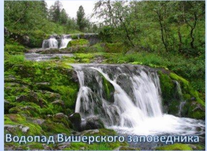
Водопад Вишерского заповедника