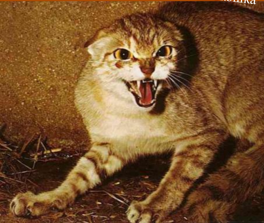
Африканская дикая кошка