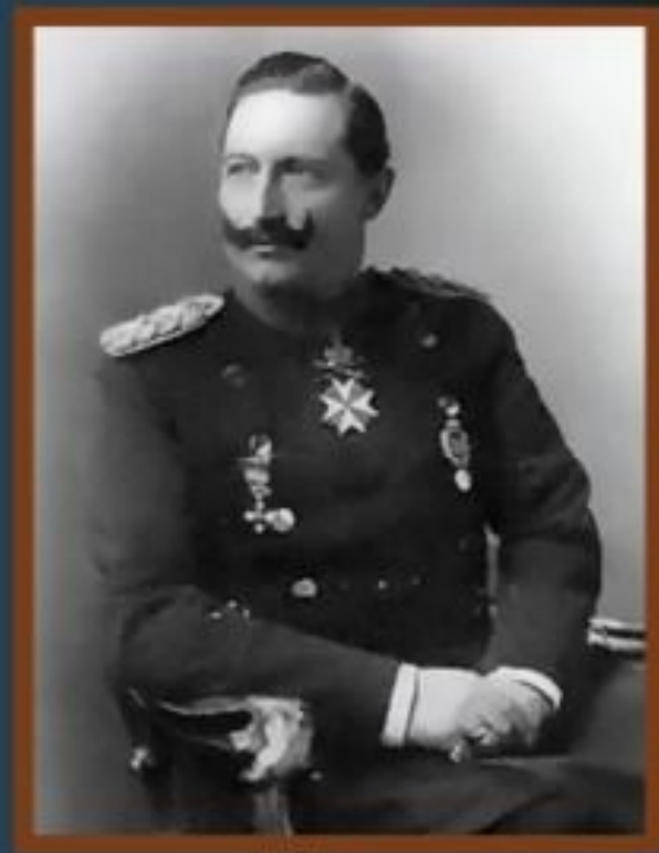
Император Вильгельм II