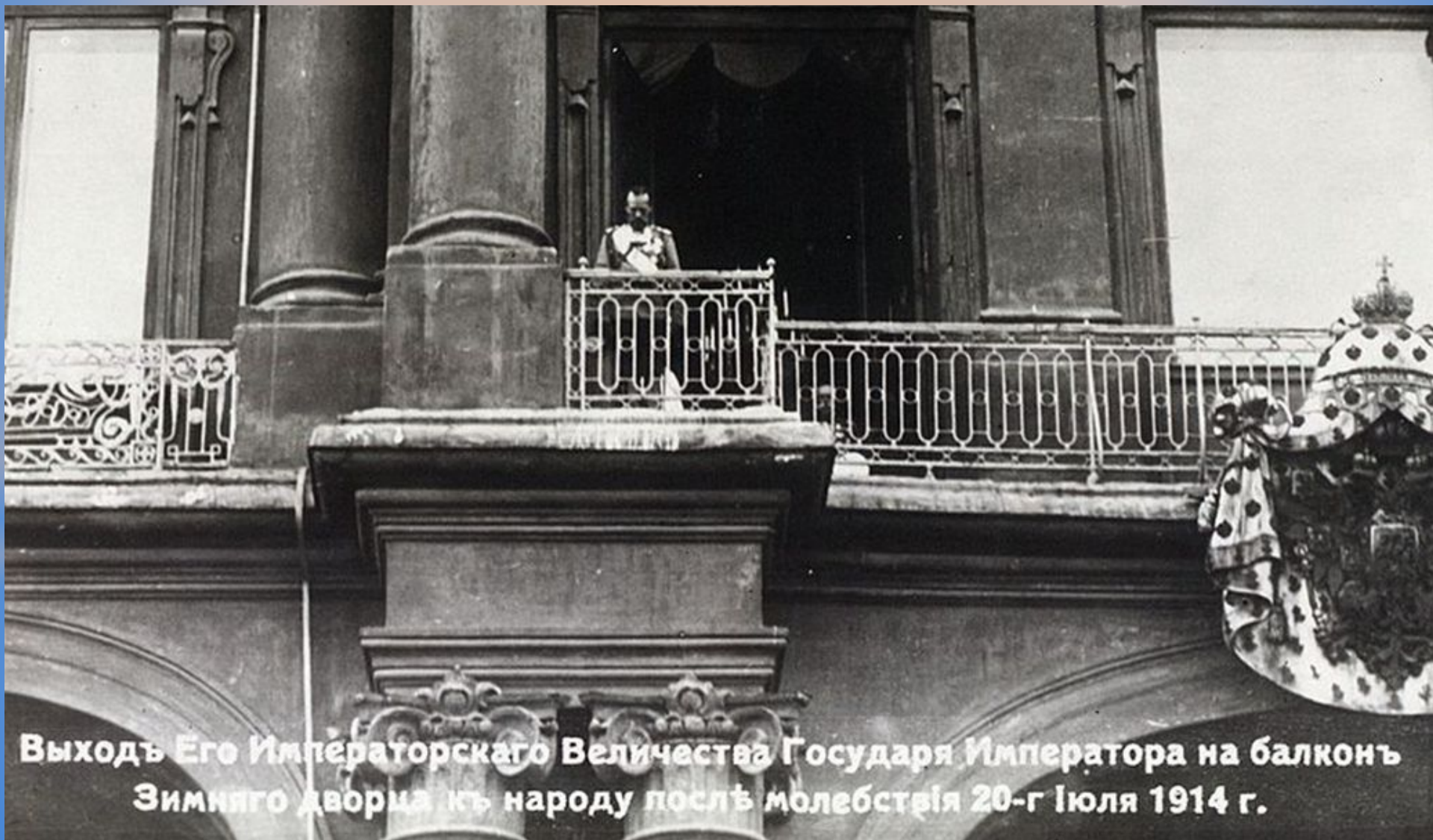
Выходъ Его Императорскаго Величества Государя Императора на балконъ Зимняго дворца къ народу послѣ молебствія 20-г Іюля 1914 г.

Указ о всеобщей мобилизации русских войск с 17(30) июля Николай II издал после долгих колебаний.