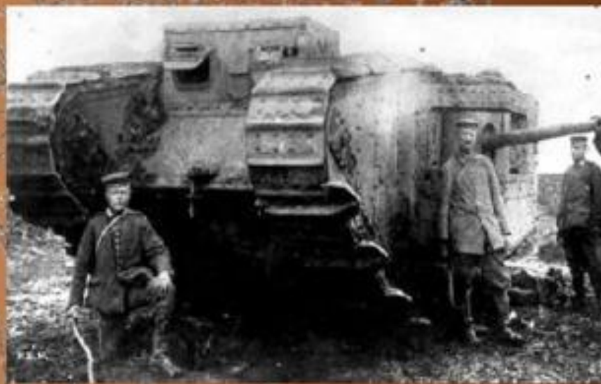
Британский тяжёлый танк Mark V