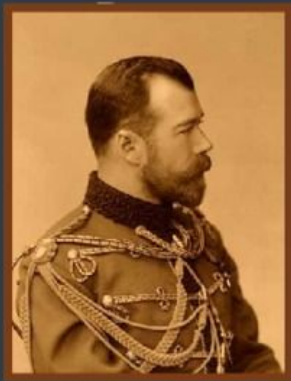
Император Николай II

1 августа 1914 года Германия объявила войну