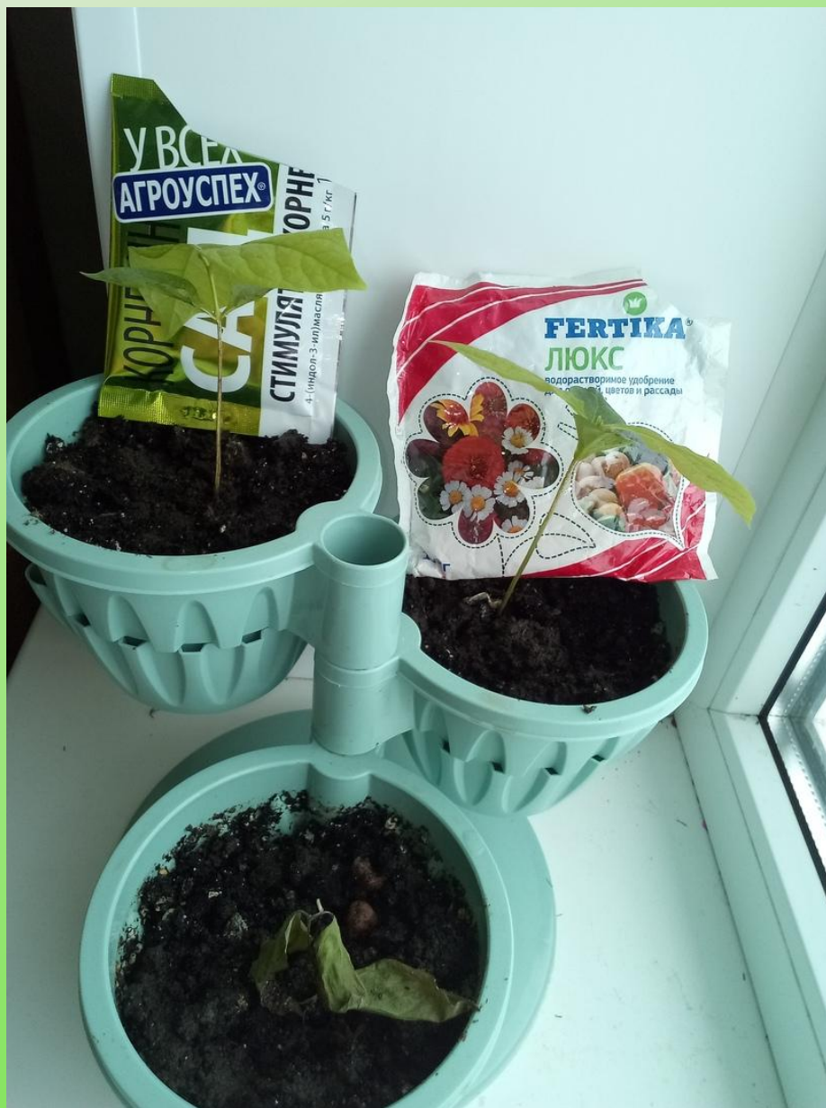
Рис. 2. Саженьцы с относящимися к ним удобрениями.