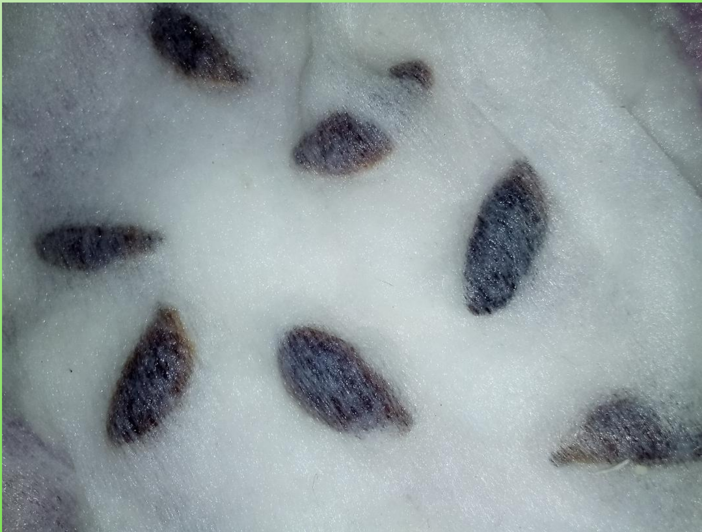
Рис.1 Проращивание семян