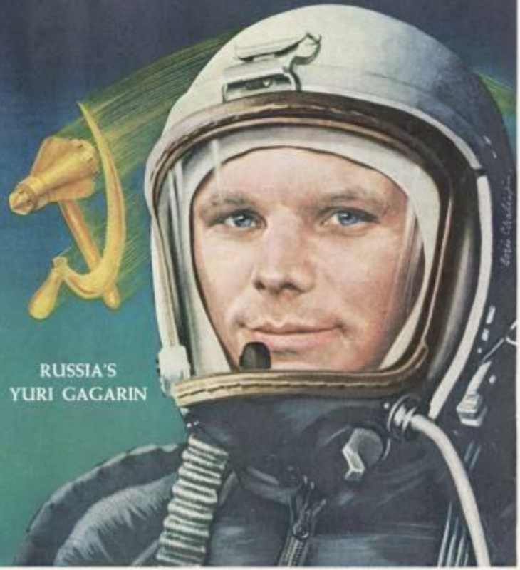
RUSSIA'S YURI GAGARIN