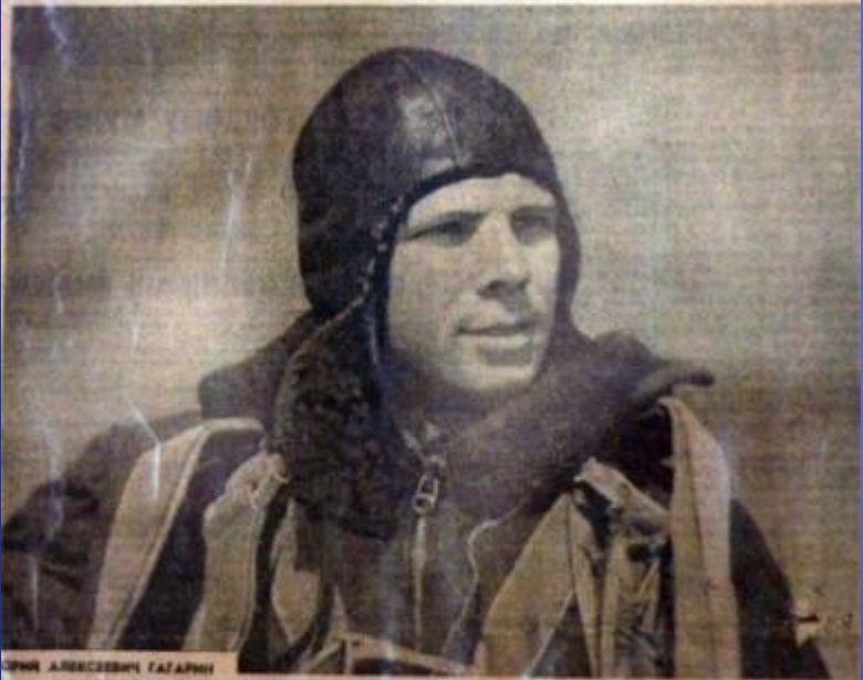
ЮРИЙ АЛЕКСАНДРОВИЧ ГАГАРИН

12 АПРЕЛЯ 1961 ГОДА В 10 ЧАСОВ 55 МИНУТ КОСМИЧЕСКИЙ КОРАБЛЬ-СПУТНИК «ВОСТОК» БЛАГОПОЛУЧНО ВЕРНУЛСЯ НА СВЯЩЕННУЮ ЗЕМЛЮ НАШЕЙ РОДИНЫ