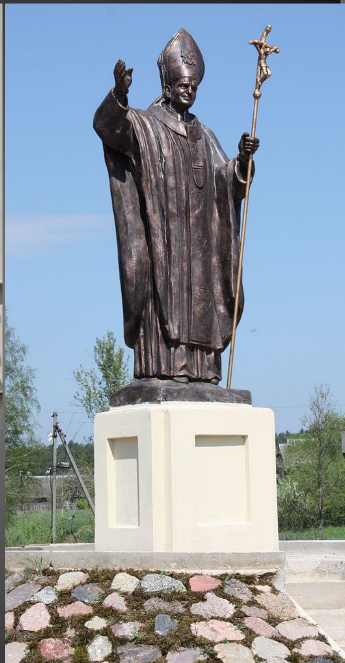
Памятник Иоанну Павлу II