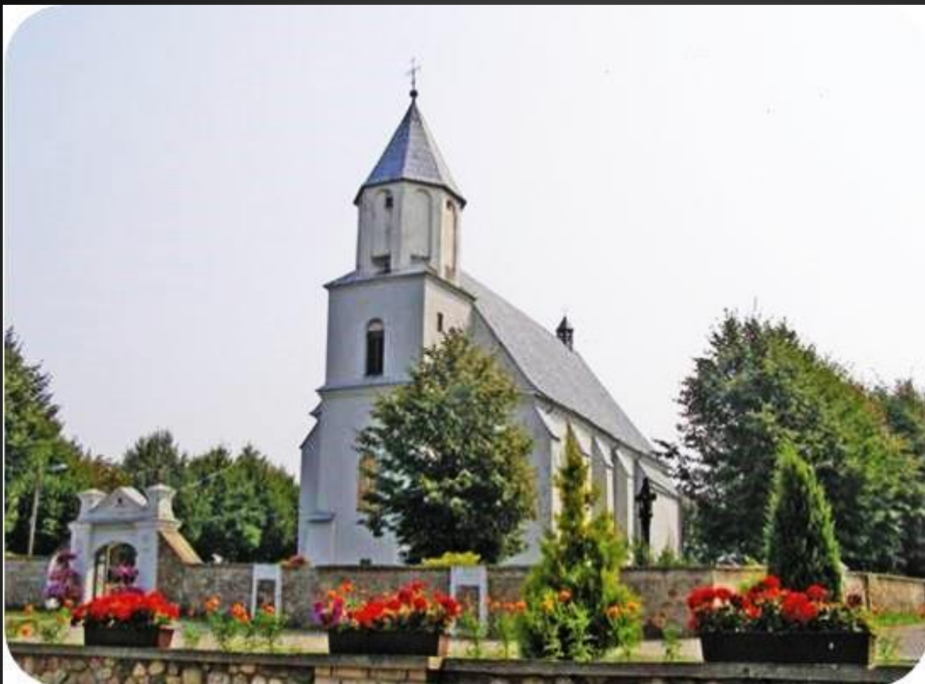
Костёл в д.Деревное Столбцовский район