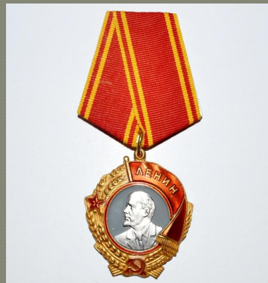
Два ордена Ленина