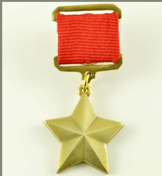
Золотая Звезда Героя Советского Союза

14 Февраля 1943 года за мужество и воинскую доблесть, проявленные в боях с врагами, посмертно удостоен звания Героя Советского Союза. Награждён орденами Ленина (дважды).