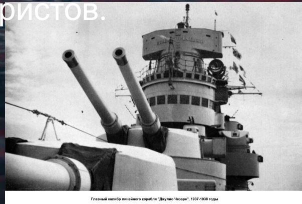
Главный калибр линейного корабля "Джулио Чезаре". 1937-1939 годы

На момент гибели линейному кораблю «Новороссийск» исполнилось 44 года — срок для корабля почтенный. Большую часть своей жизни линкор носил другое имя — «Джулио Чезаре» («Юлий Цезарь»), плавая под флагом итальянских ВМС. Он был заложен в Генуе летом 1910 года и спущен на воду в 1915 году. В Первой мировой войне линкор участия не принимал, в 1920-х годах использовался как учебный корабль для подготовки морских артиллеристов.