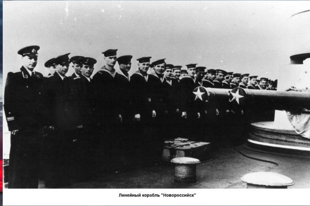
Линейный корабль "Новороссийск"

На момент взрыва командир линкора капитан 1 ранга Кухта находился в отпуске. Обязанности его исполнял старший помощник капитан 2 ранга Хуршудов. Согласно штатному расписанию, на линкоре находились 68 офицеров, 243 старшины, 1231 матрос. После того как "Новороссийск" ошвартовался, часть экипажа съехала в увольнение. На борту оставались более полутора тысяч человек: часть экипажа и новое пополнение (200 человек), курсанты морских училищ и солдаты, накануне прибывшие на линкор.