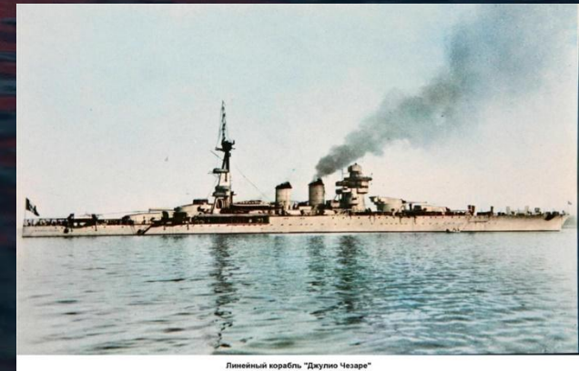
Линейный корабль "Джулио Чезаре"