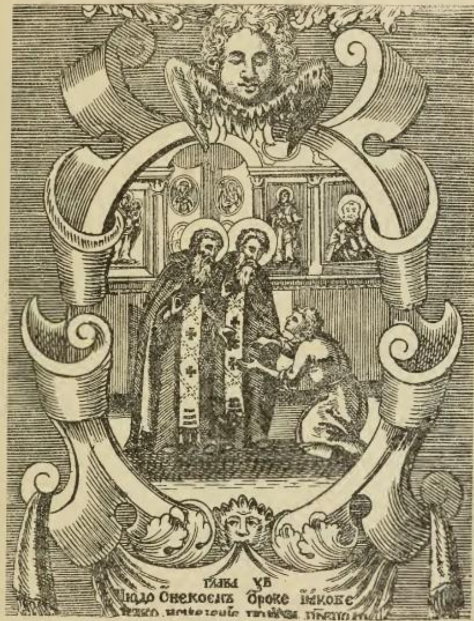
Рис. XXI. Зосима и Савватий съ дѣніемъ, русская гравюра середины XVIII в.,