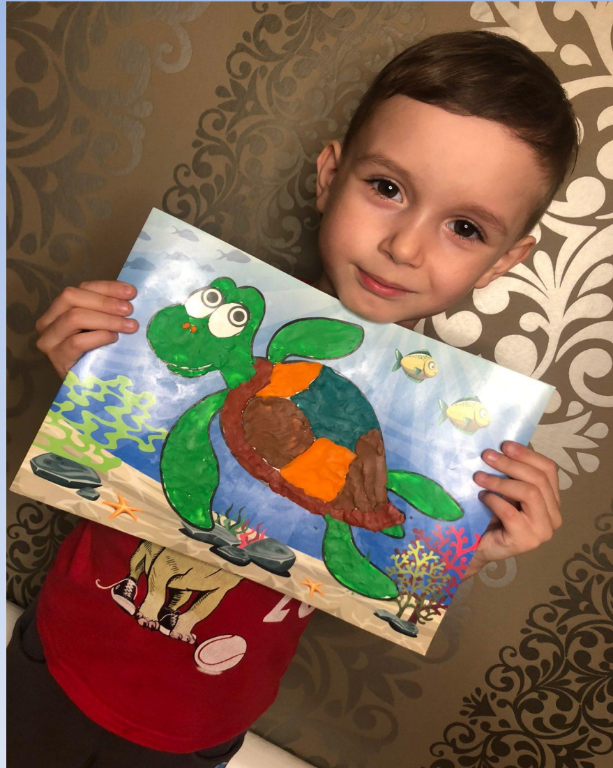
Рисунок «Подводный мир»