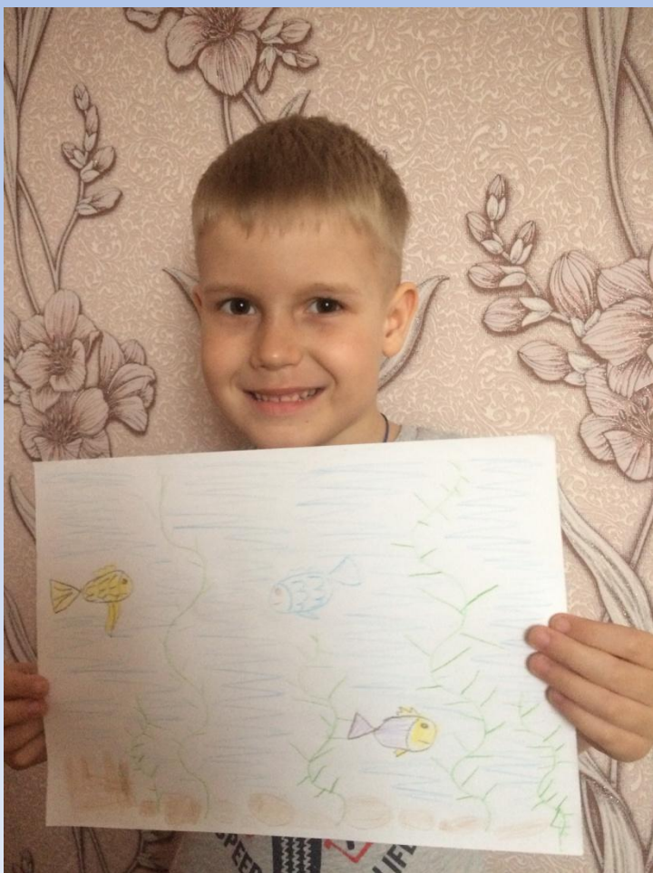
«На морском дне»