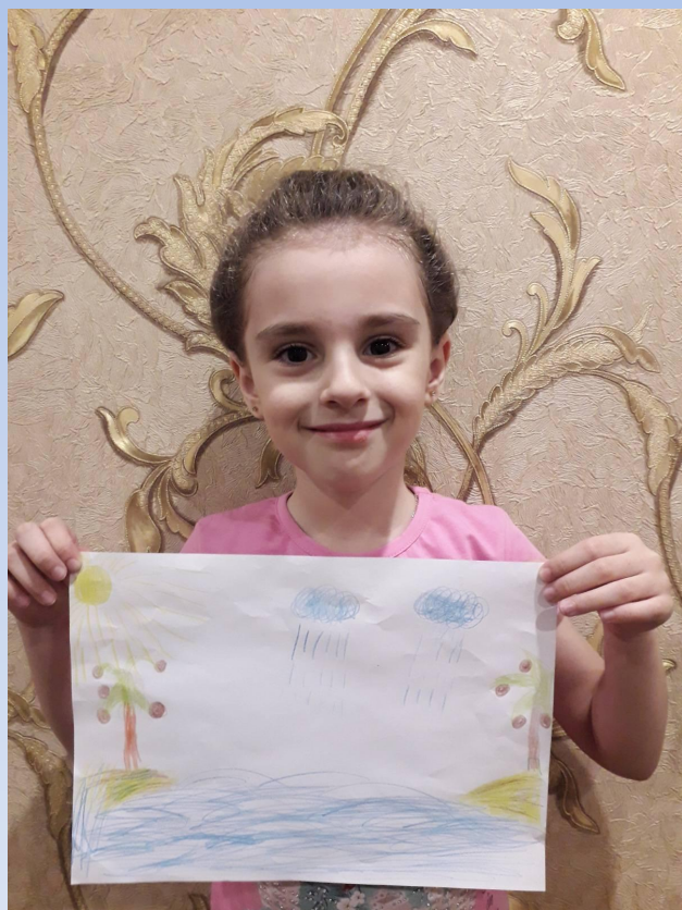
Рисование «Волшебные капельки»