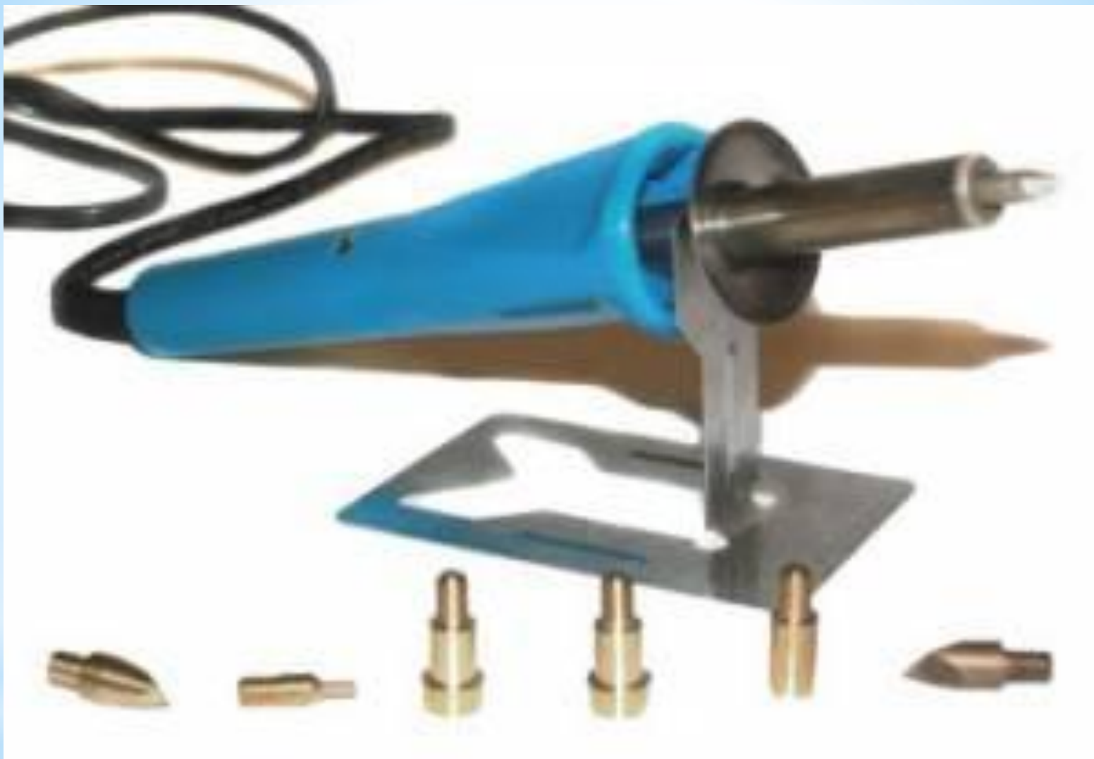
Электровыжигатель паяльникого типа со сменными насадками