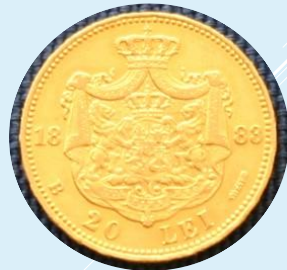
Румыния, 1883, 20 леев