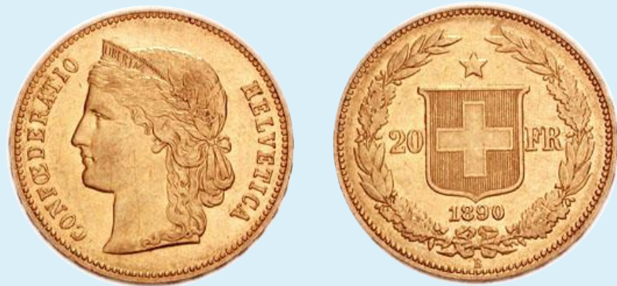
Швейцария, 20 франков