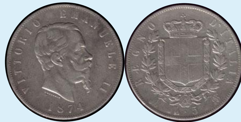
Виктор Эммануил II 5 лир 1874