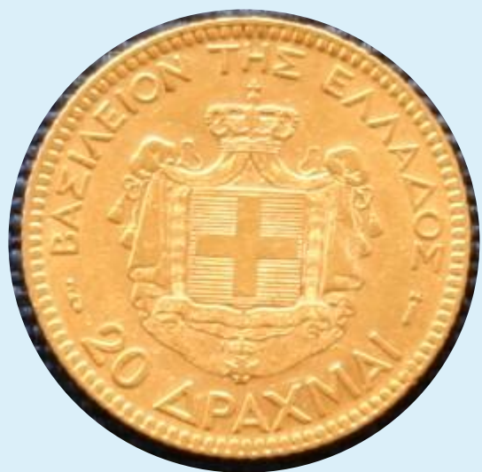
Греция 1884, 20 драхм