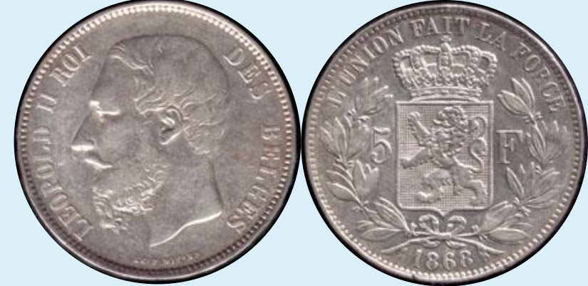
Леопольд II (король Бельгии) 5 франков 1868