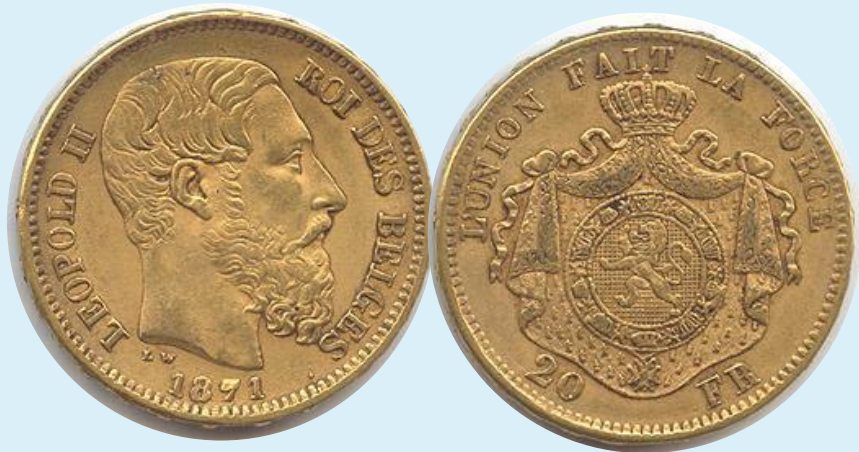
Бельгия, 20 франков