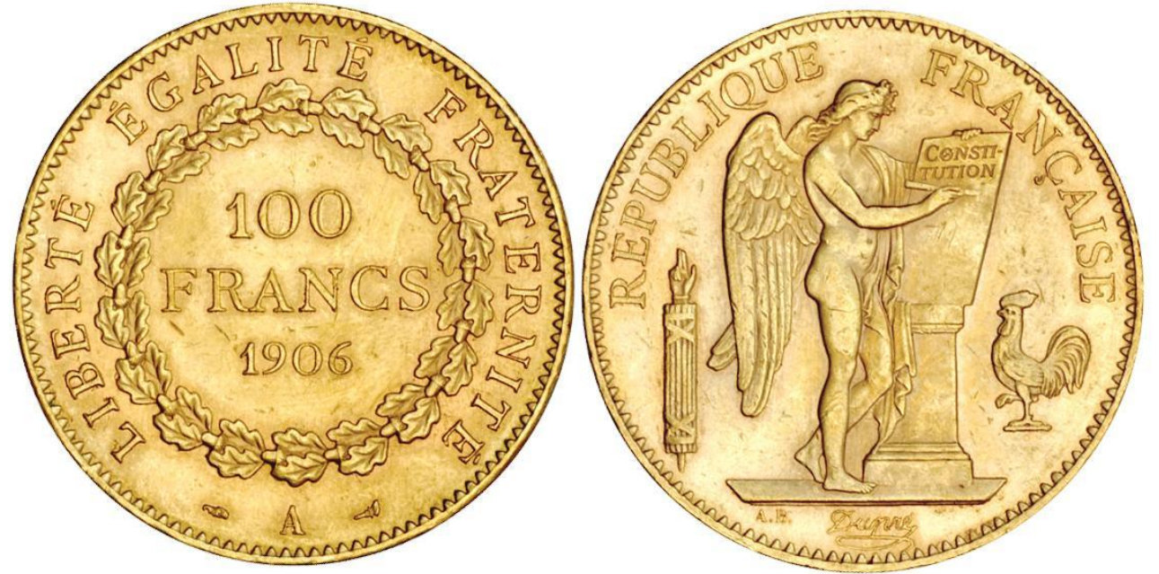
ФРАНЦИЯ, 100 ФРАНКОВ

Денежной единицей всех стран союза был объявлен французский франк, который чеканился как из золота (монеты в 100, 50, 20 и 10 франков), так и из серебра (5 фр.)