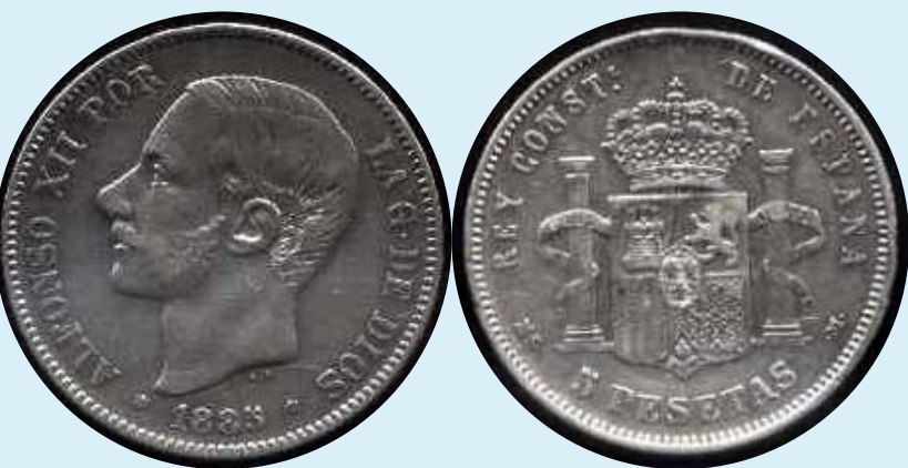
Альфронс XII 5 испанских песет 1885