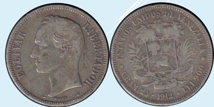
Симон Боливар 5 венесуэльских боливаров 1912