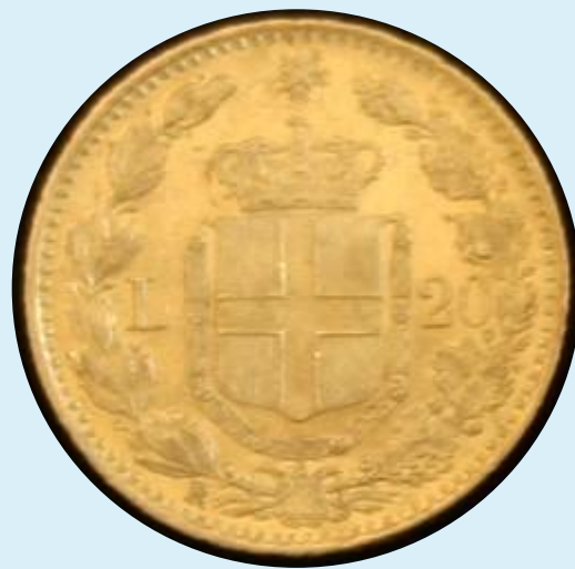
Италия, 1882, 20 лир