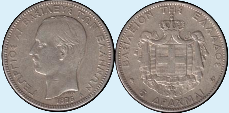
Георг I (король Греции) 5 драхм 1876