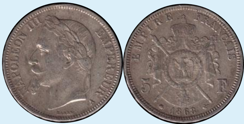
Наполеон III Бонапарт 5 франков 1868