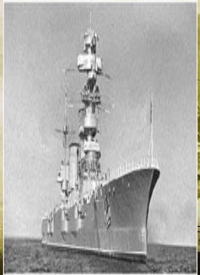
Линейный корабль «Октябрьская революция»