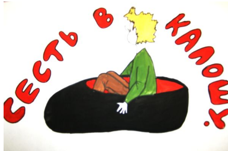
Иллюстрации Крутолевич Н.