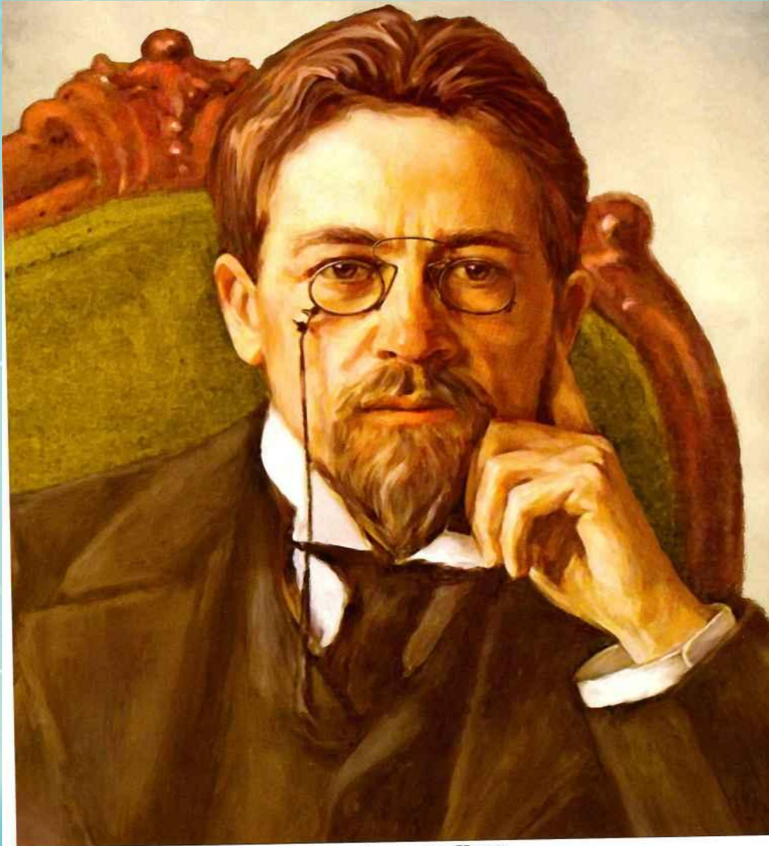
АНТОН ПАВЛОВИЧ ЧЕХОВ