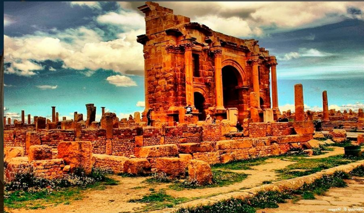
ДРЕВНЕРИМСКИЙ ГОРОД ТИМГАД В АЛЖИРЕ