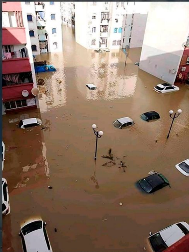
НАВОДНЕНИЕ В АЛЖИРЕ

КЛИМАТ АЛЖИРА. КЛИМАТ СЕВЕРНОГО АЛЖИРА СУБТРОПИЧЕСКИЙ. СРЕДНИЕ ТЕМПЕРАТУРЫ ЯНВАРЯ КОЛЕБЛЮТСЯ ОТ + 5°C ДО + 12°C, ИЮЛЯ — ОКОЛО + 25 °C.