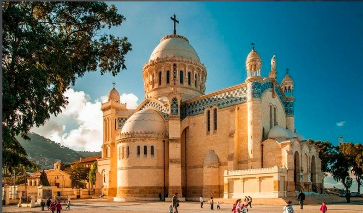
ХРАМ БОГОМАТЕРИ АФРИКИ В АЛЖИРЕ