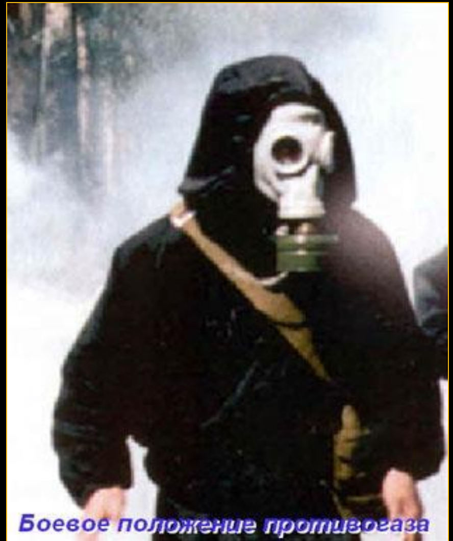
Боевое положение противогаса

1. Двигаться быстро, но не бежать, стараться не поднимать пыли