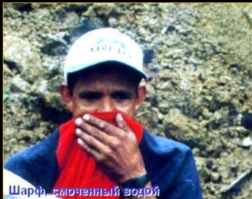
Шарф, смоченный водой

4. Без промедления надеть респиратор или противогаз; при их отсутствии – ватно-марлевые повязки или любые подручные изделия из ткани (платки, шарфы), намочив их водой.