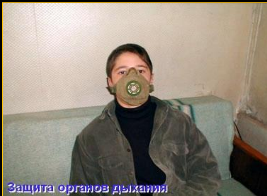
Защита органов дыхания