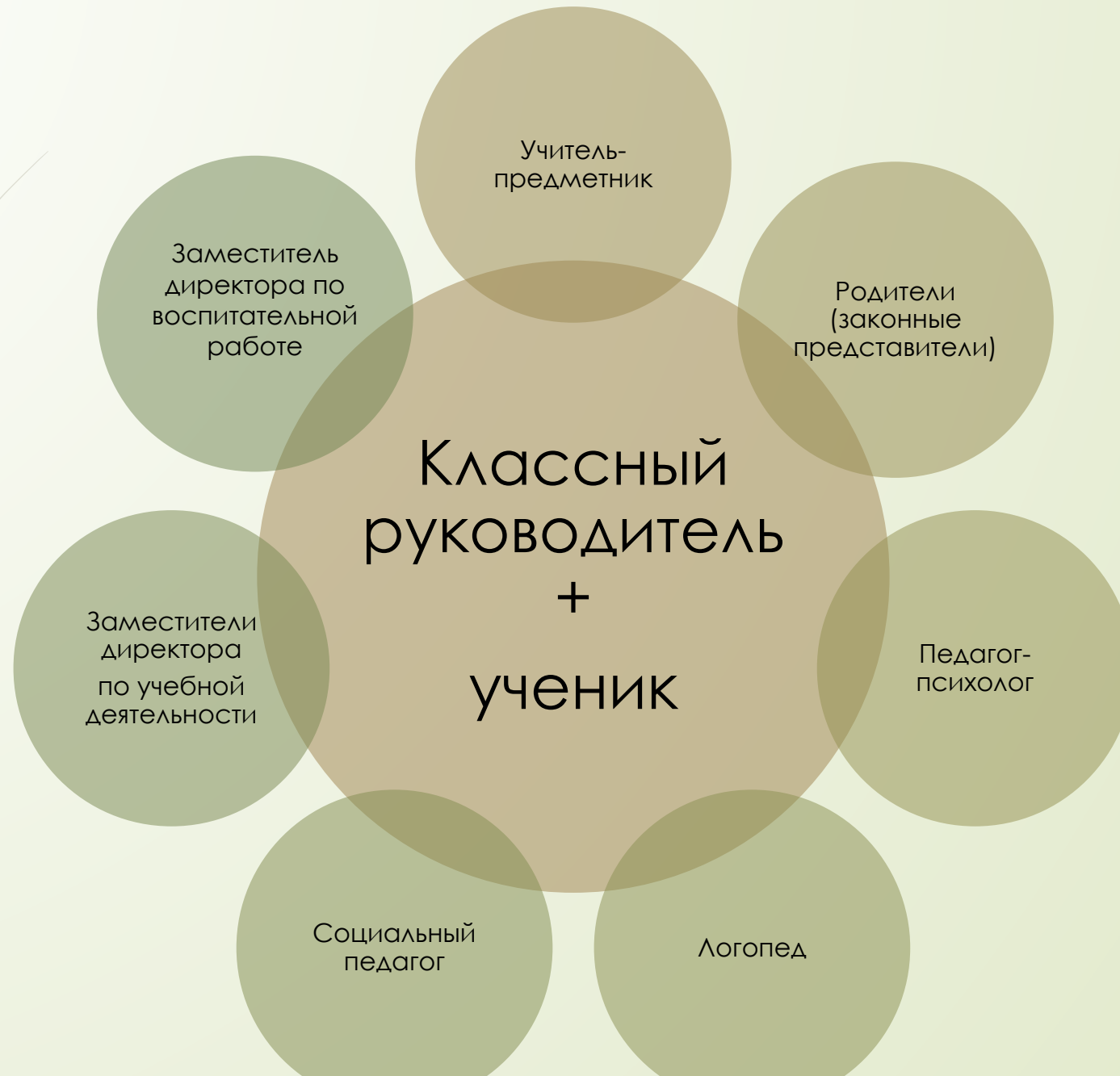
Схема взаимодействия участников образовательных отношений