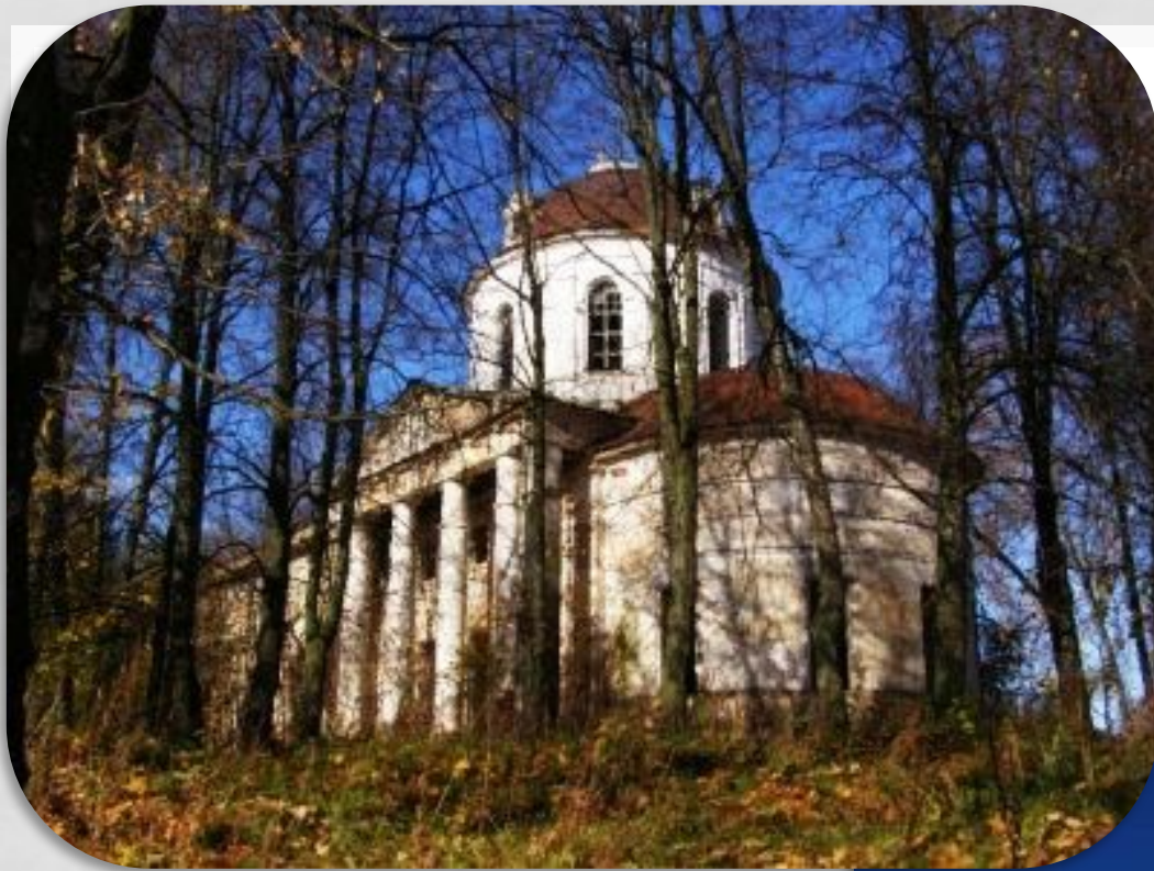
Усадьба помещика А.Г. Безобразова