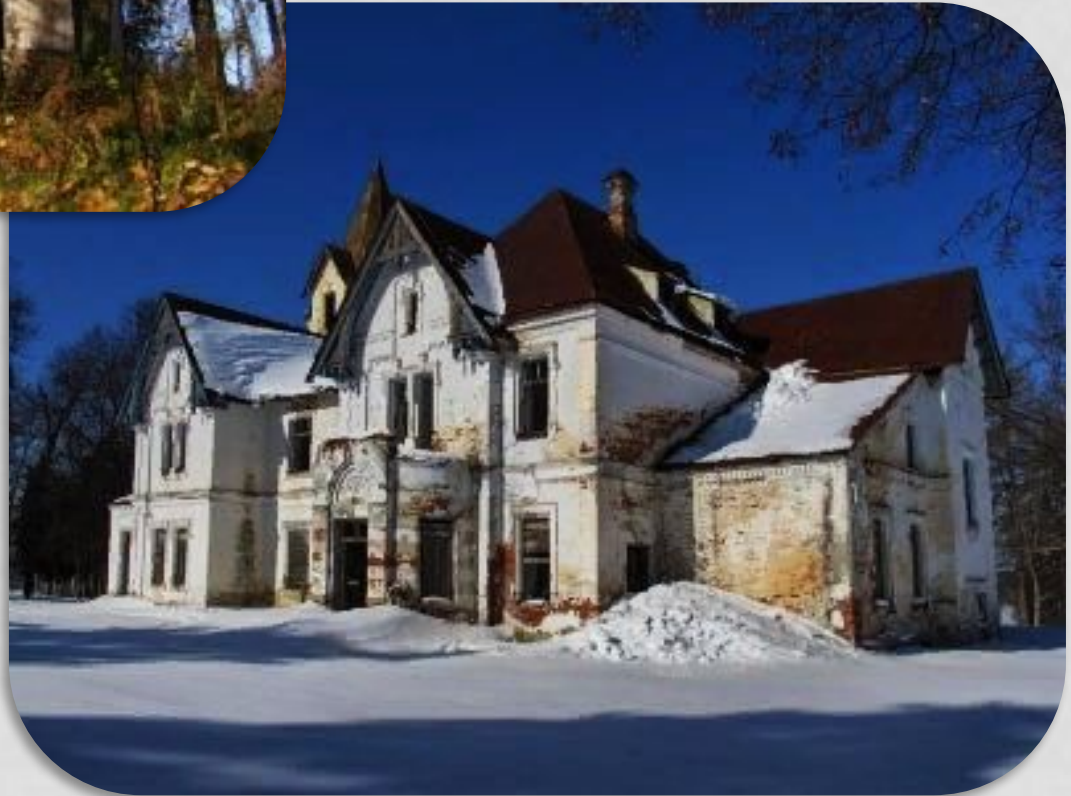
Усадьба князей Грузинских