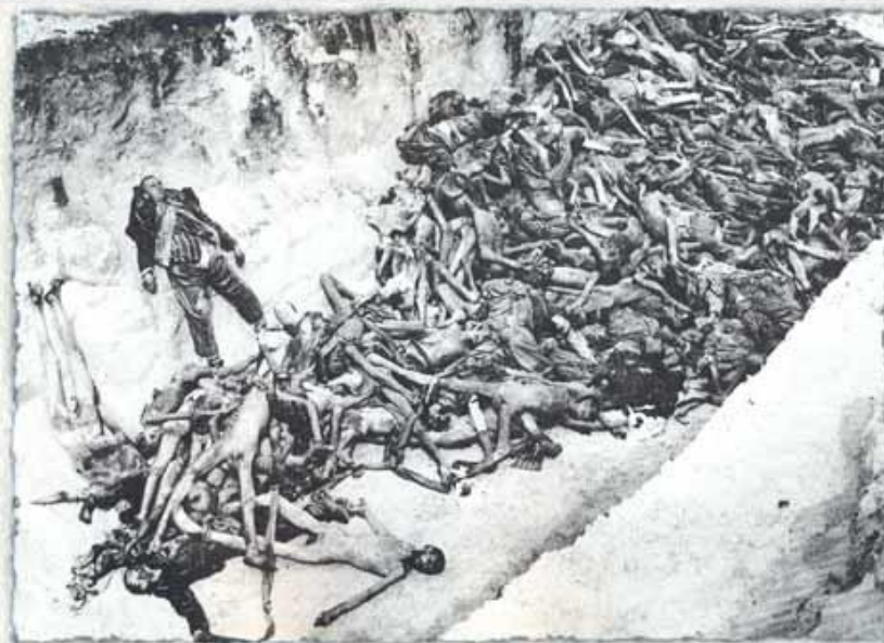
Трупы еврейских заключённых во рву. Оп.: Брухвельд С., Левин П. "Передайте об этом детям вашим... История холокоста в Европе". М., 2001. С. 83.