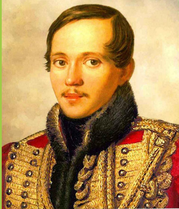
Михаил Юрьевич Лермонтов