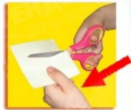
При работе следи за пальцами левой руки