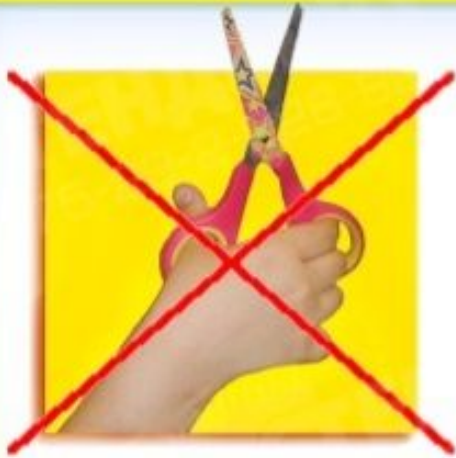
Не держи ножницы концами вверх