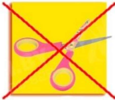
Не оставляй ножницы в открытом виде