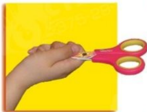
Передавай ножницы в закрытом виде кольцами в сторону товарища