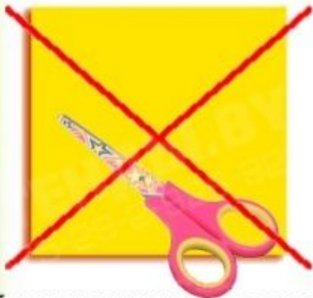
Клади ножницы на стол так, чтобы они не свешивались за край стола