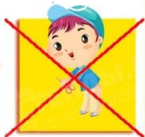
Не режь ножницами на ходу, не подходи к товарищу когда он режет