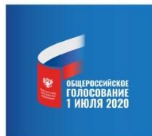
Цветной вариант логотипа на темном фоне