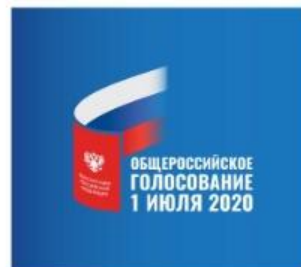
Цветной вариант логотипа на темном фоне