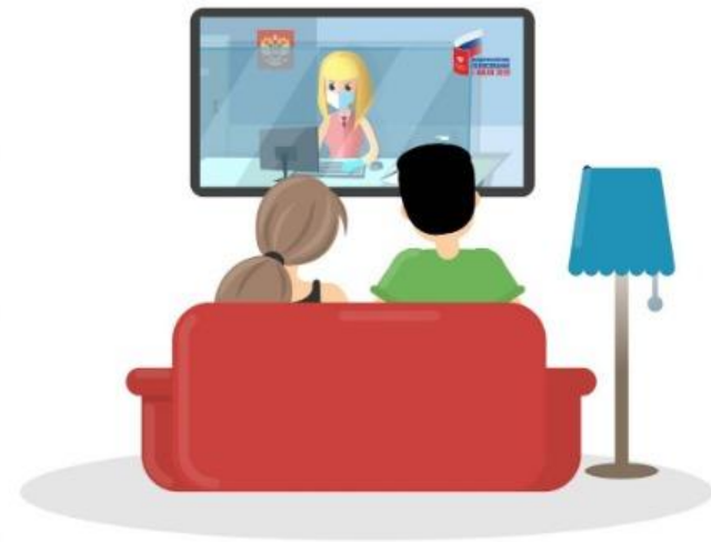
Телевидение и радио

Телефон Информационно-справочного центра ЦИК России 8-800-20 000 20