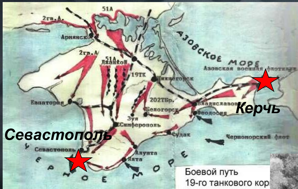
Боевой путь 19-го танкового кор