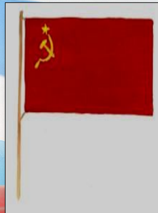
Государственный флаг СССР