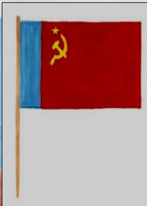
Государственный флаг РСФСР 1954г.