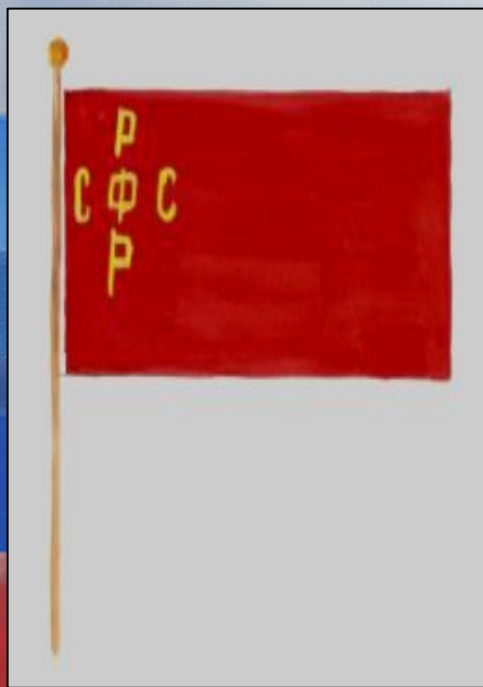
Государственный флаг РСФСР 1918г.

С установлением советской власти Государственным флагом стал флаг красного цвета с изображением серпа и молота.