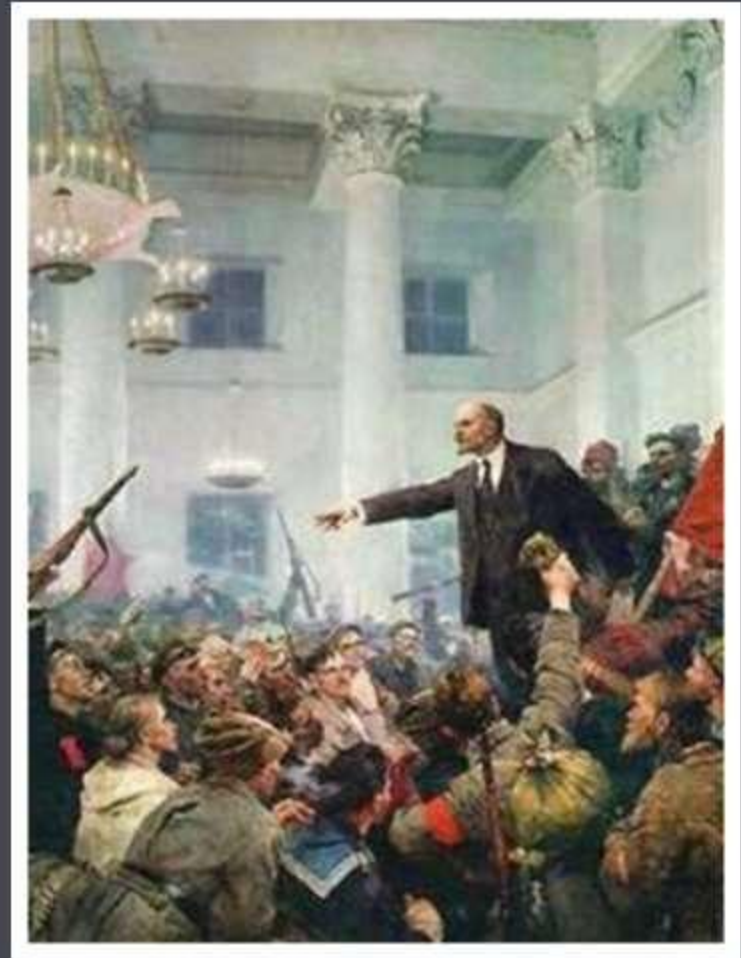
С. Серов . Ленин проголошує Радянську владу.

Курс на встановлення влади більшовиків на всій території Російської держави