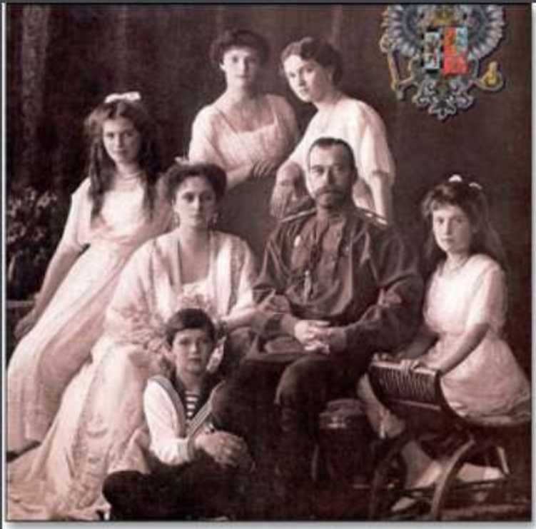
Микола II з родиною

« У ці вирішальні дні в житті Росії ми вирішили, що нашим боргом совісті є полегшення народу нашої тісної єдності, і для згуртованості всіх сил народних для швидшого досягнення перемоги, і, в згоді з Державною думою, визнали ми благом зректися престолу держави Російської та скласти з себе верховну владу. Не бажаючи розлучатися з улюбленим сином нашим, ми передаємо спадок наш нашому братові, нашому великому князеві Михайлу Олександровичу та благословляємо його на вступ на престол держави Російської».