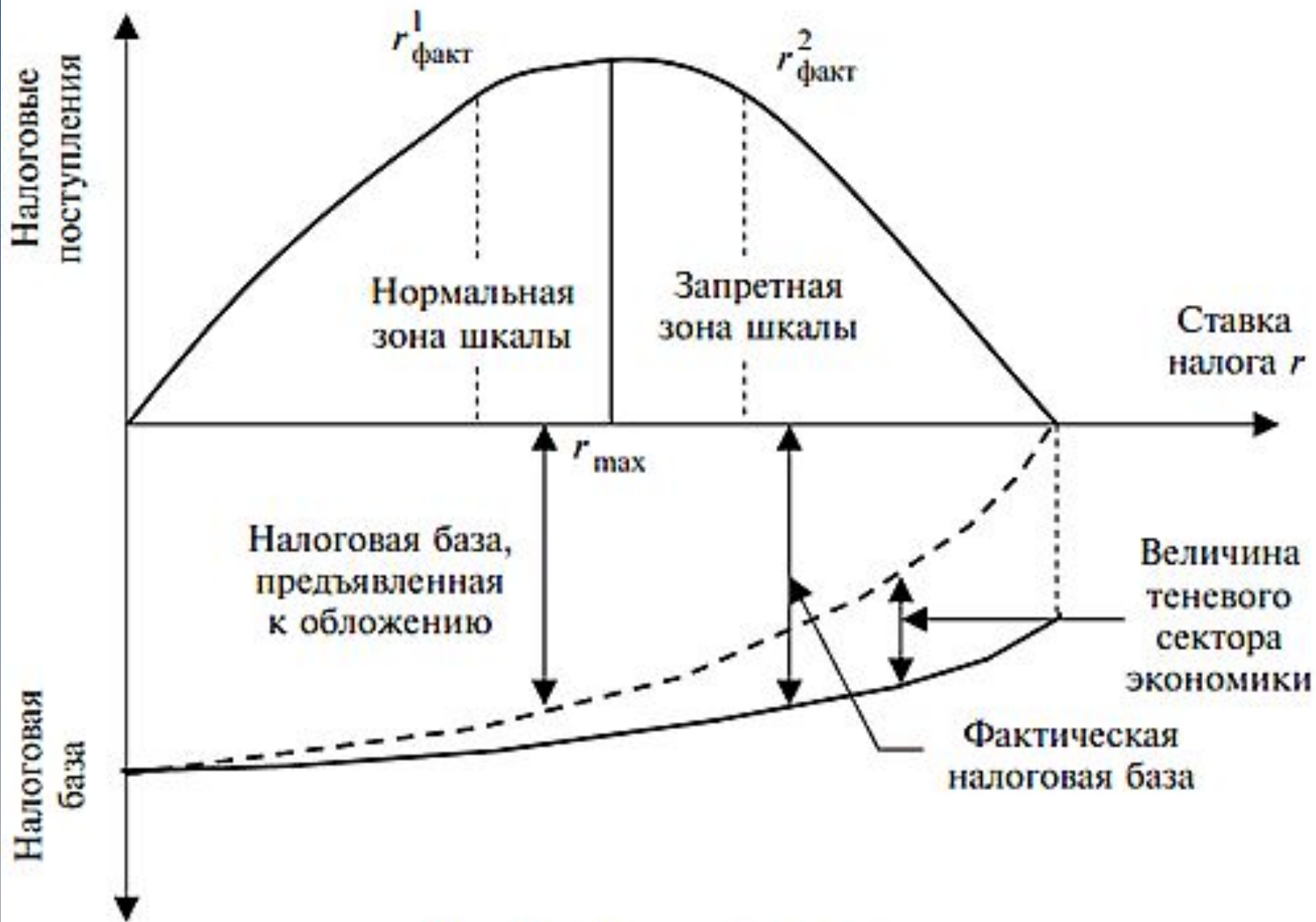
Рис. 1.7. Кривая Лаффера