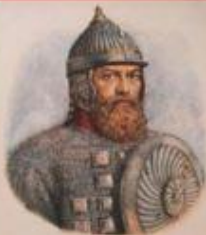
Дмитрий Пожарский 1598 – 1642

Князь, воевода, глава Второго ополчения, с 1613 года боярин. Происходил из старинного обедневшего рода князей Стародубских