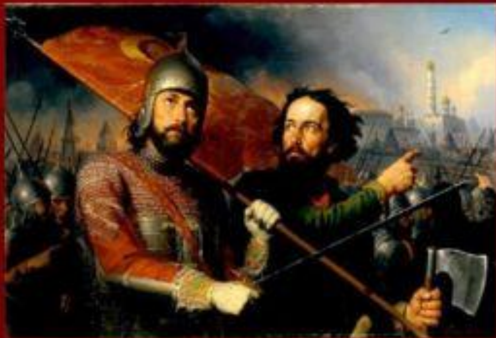
Минин (справа) и Пожарский - организаторы национально-освободительной борьбы...