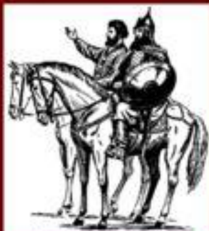
Дмитрий Пожарский и Кузьма Минин

Когда настали мирные времена, новый царь щедро наградил Минина и Пожарского. Но лучшей наградой стала память народная.