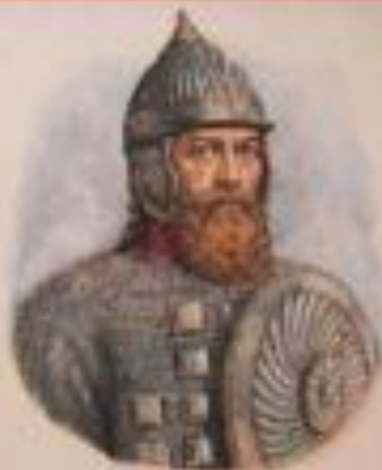
Дмитрий Пожарский 1612 - 1681