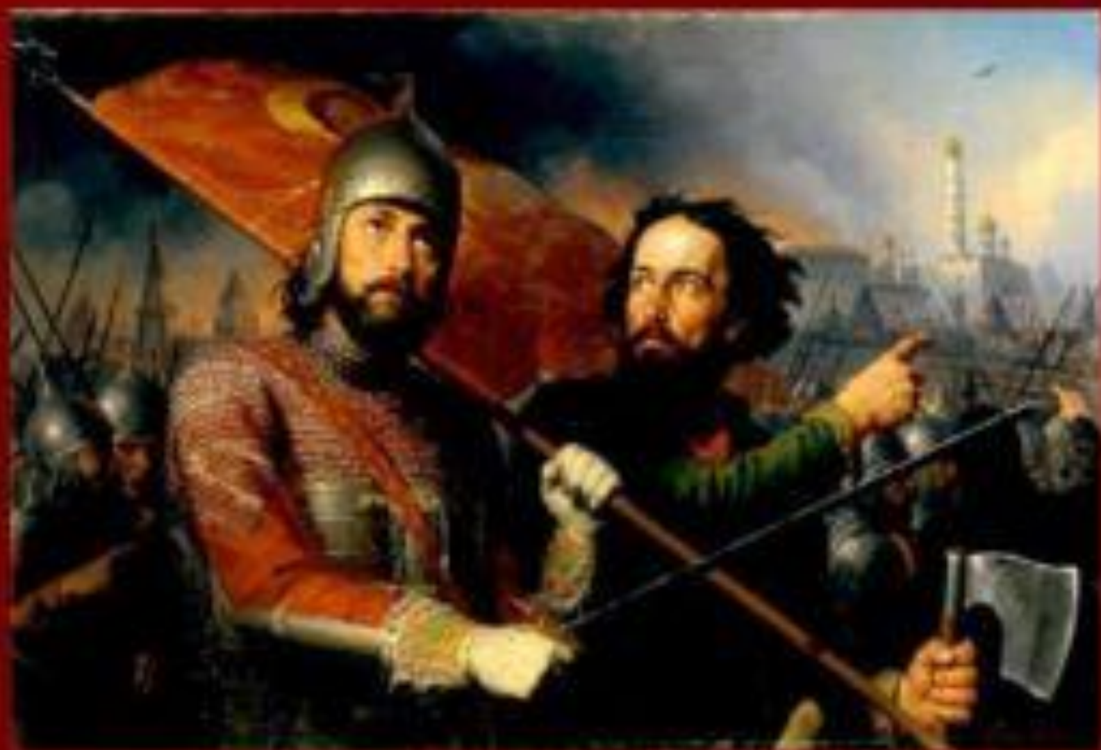
Минин (справа) и Пожарский - организаторы национально-освободительной борьбы...