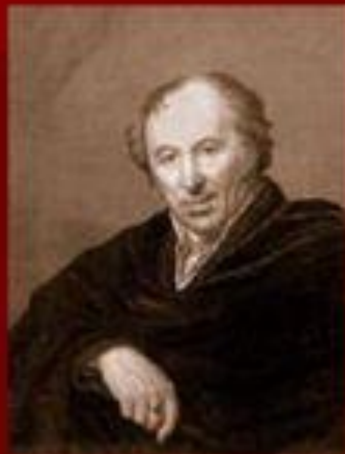
Мартос Иван Петрович (1750-1835), скульптор, профессор Санкт- Петербургской Академии художеств.