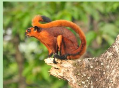
un écureuil volant – белка-летяга