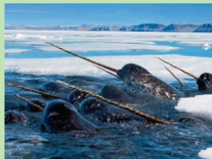
un narval - нарвал