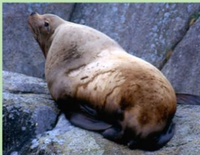
une otarie – морской лев