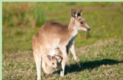
un kangourou - кенгуру