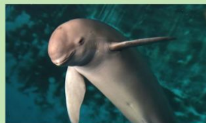
un marsouin – морская свинья