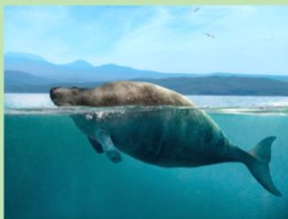
un lamentin - морская корова