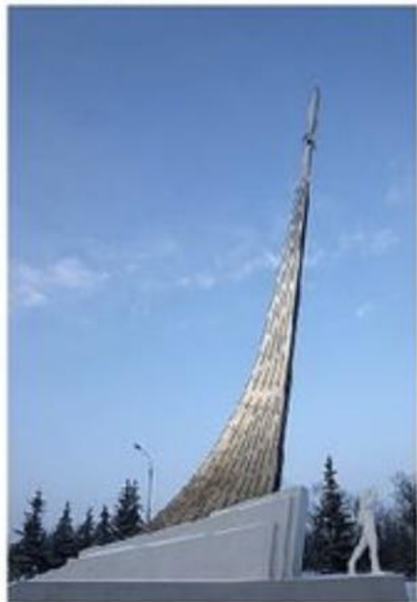
Памятник Ю. Гагарину на месте приземления возле г. Энгельс в Саратовской области