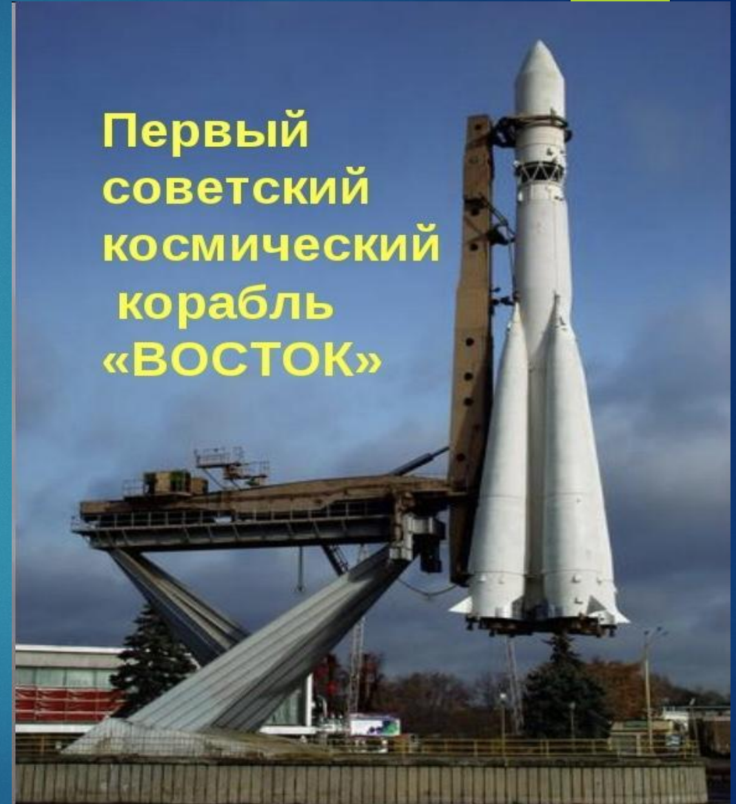
Первый советский космический корабль «ВОСТОК»