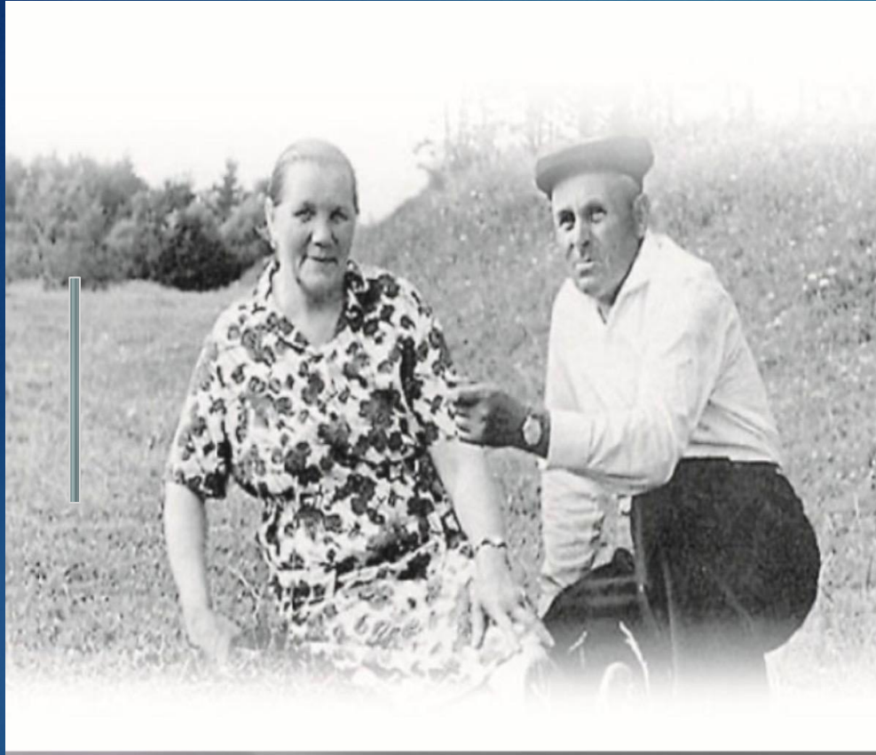
Родители Юрия Гагарина