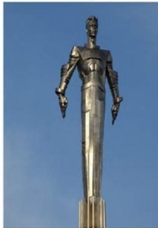
Памятник Ю. Гагарину в Москве

Во многих городах России и других странах названы улицы, площади, парки, школы и многое другое именем Юрия Алексеевича Гагарина.