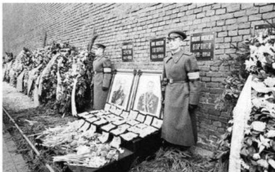
Похоронен Юрий Гагарин у Кремлёвской стены на Красной площади.