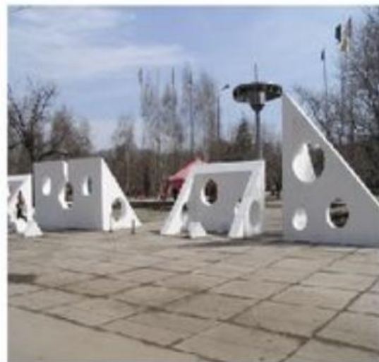
Парк им. Ю. Гагарина в Самаре