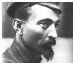
Мастер боевых искусств