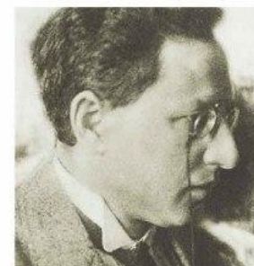
Парень, который погибнет первым