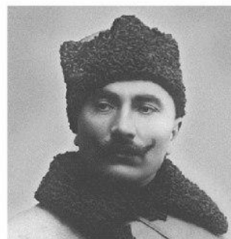
Эксперт по оружию