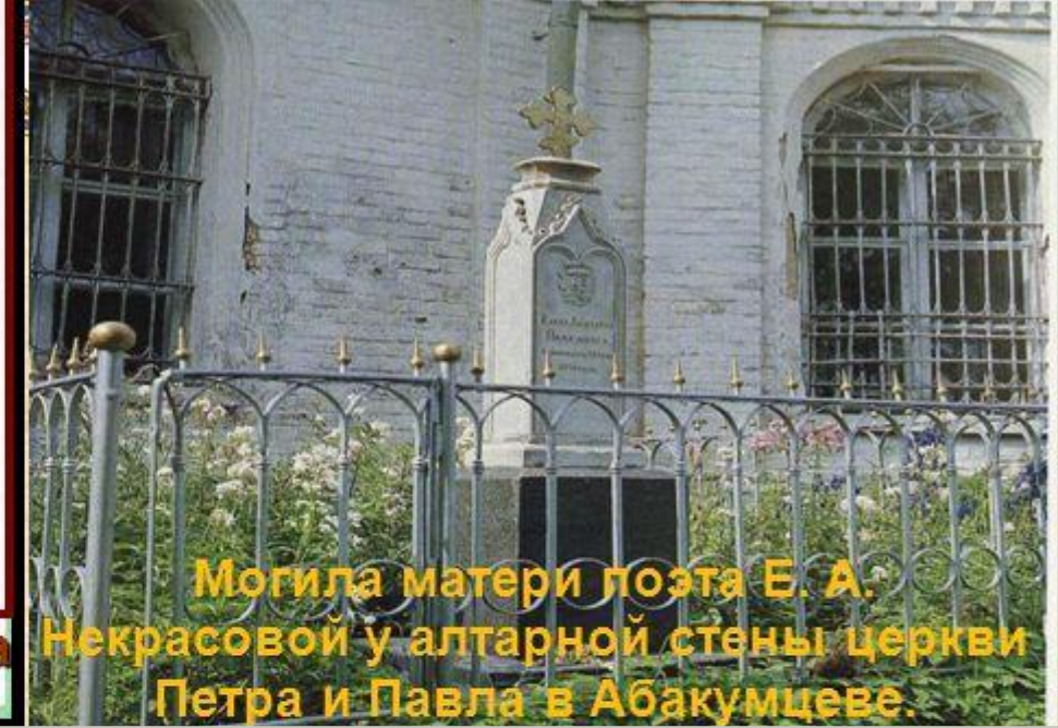
Любимое место прогулок матери поэта