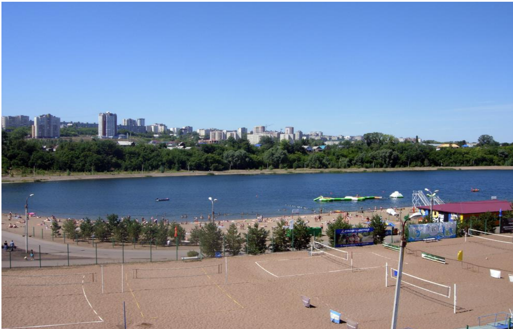
Пляж и игровые площадки