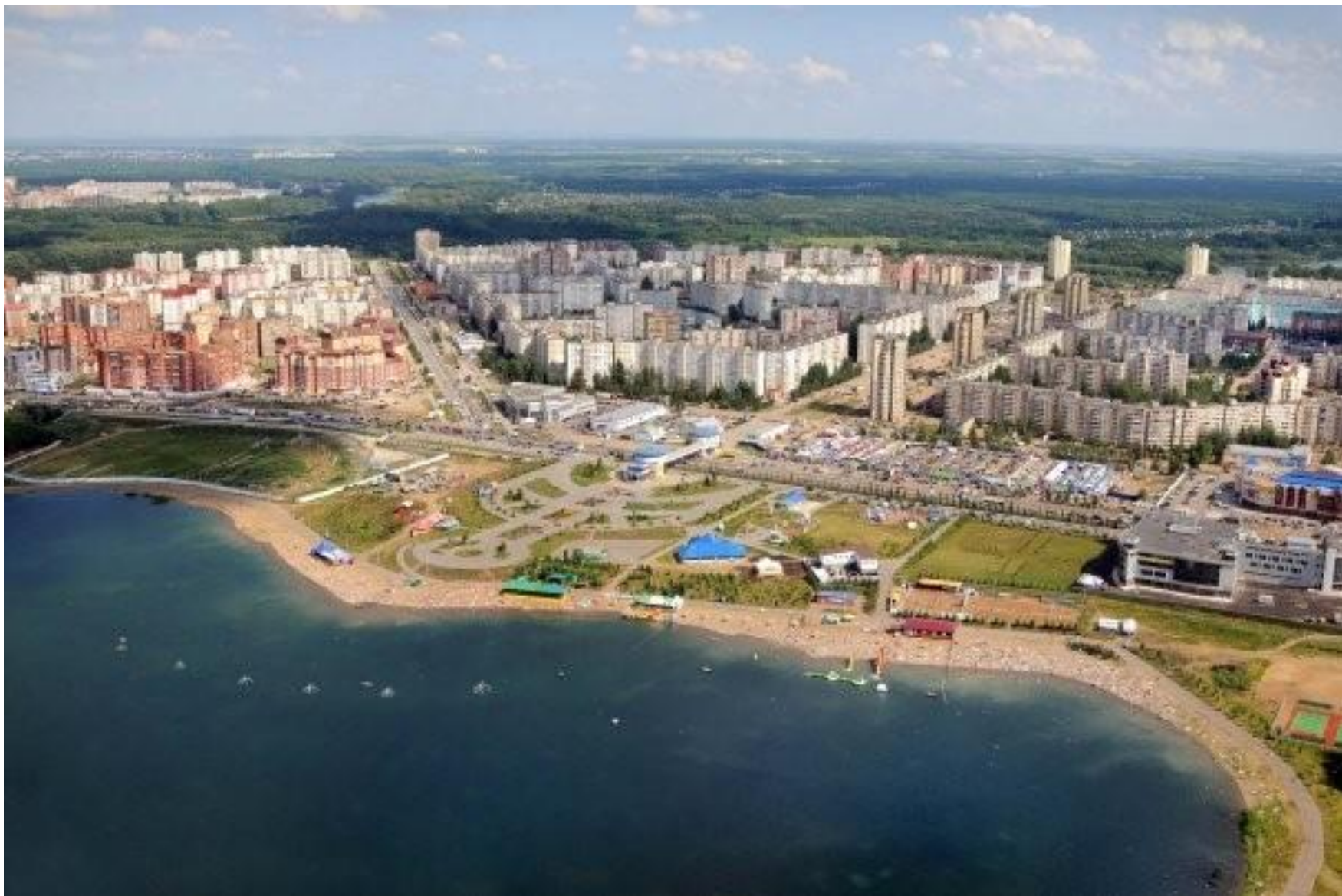
Общий вид парка