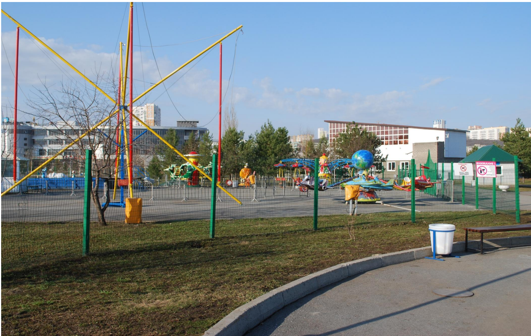
Детская игровая площадка