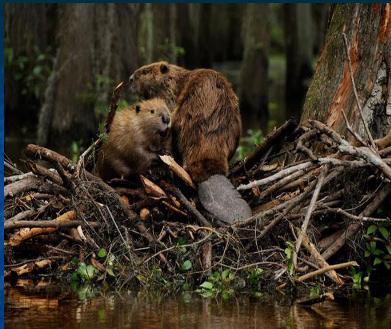
6. Бобер строит платину