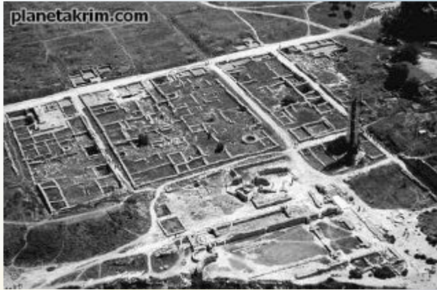
Регулярная, или прямоугольная