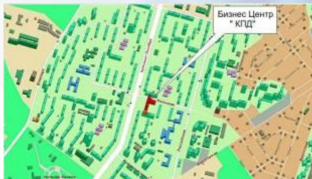
Нерегулярная, или свободная