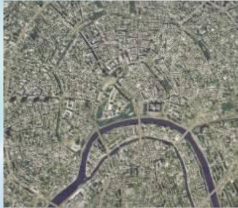
Радиально - кольцевая