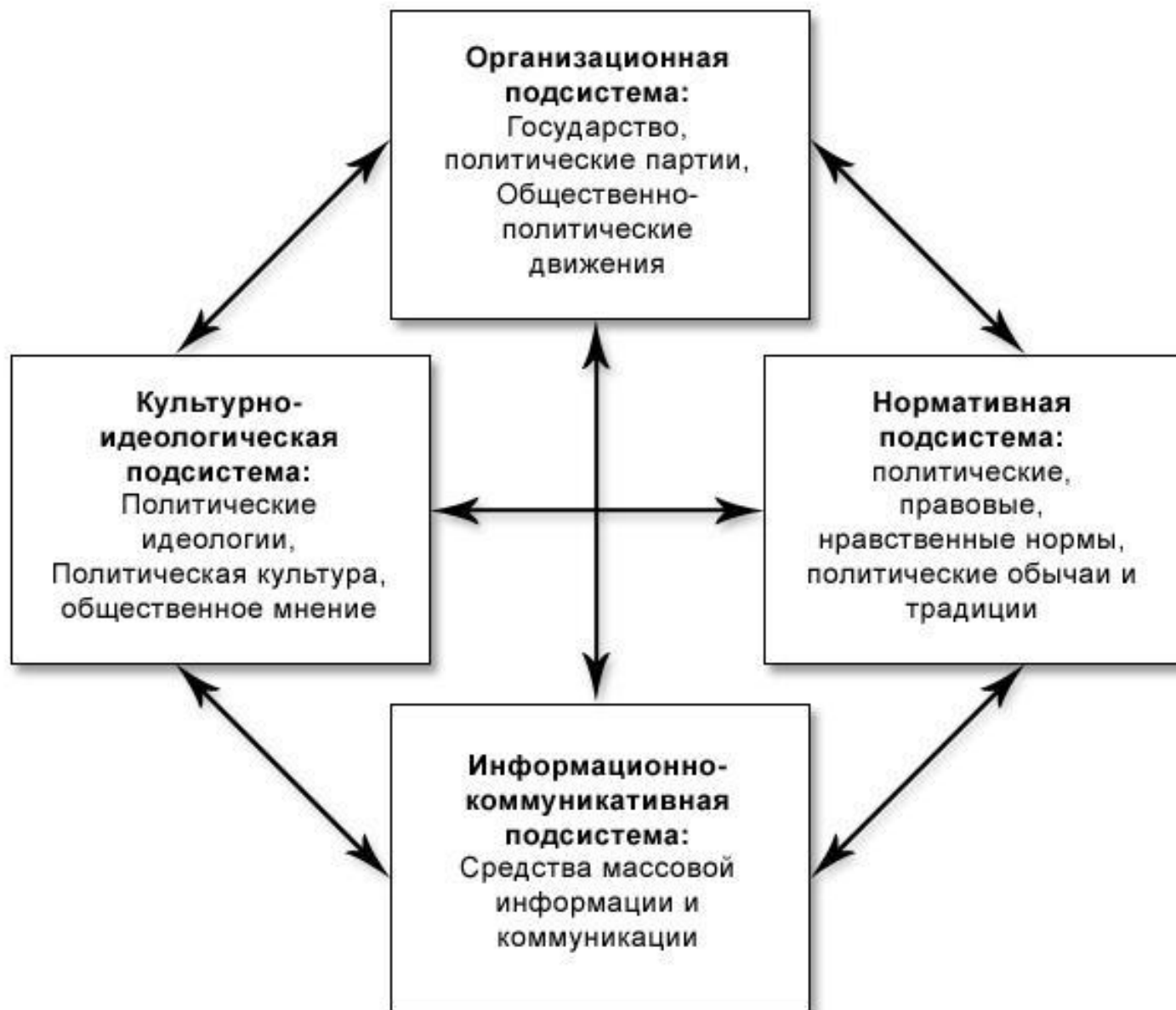
Схема: Структурные компоненты политической системы