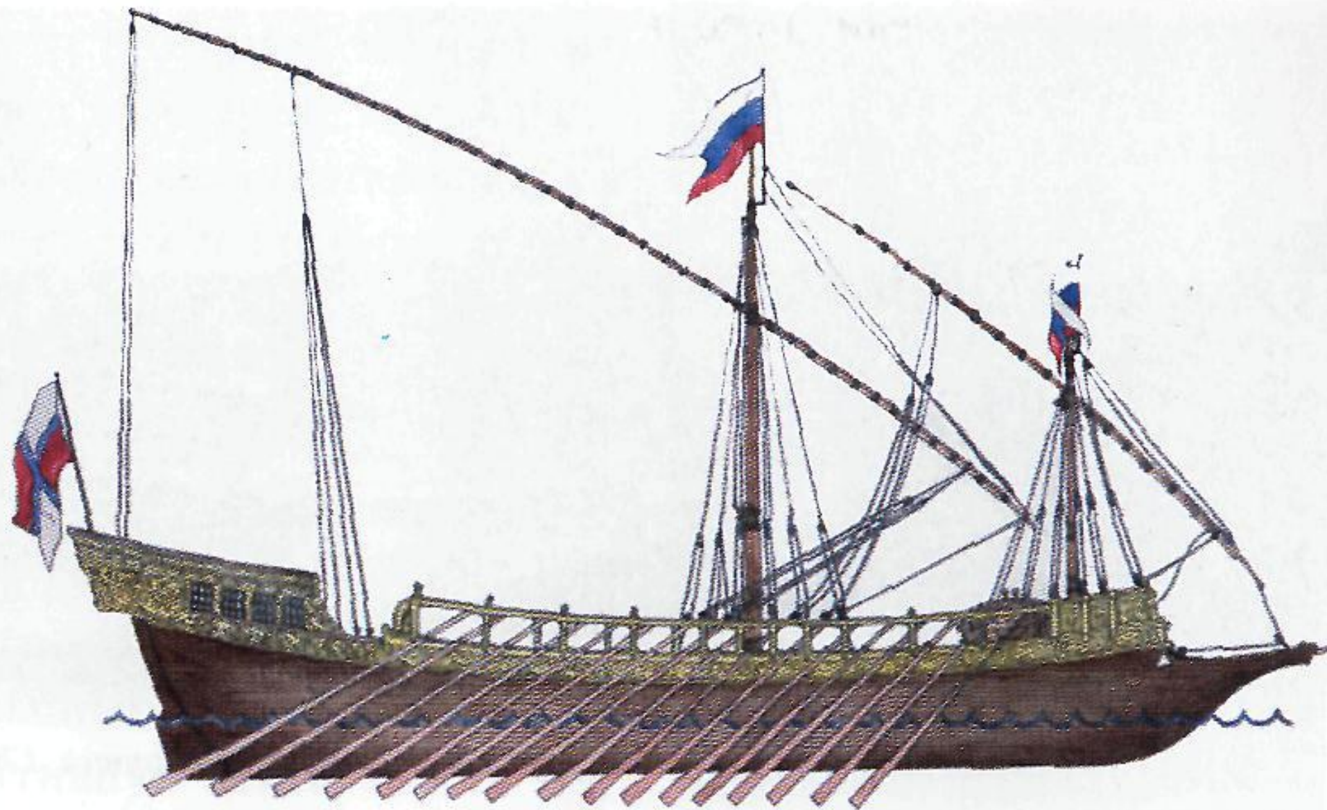
Примерно так выглядела галера «Принципиум»