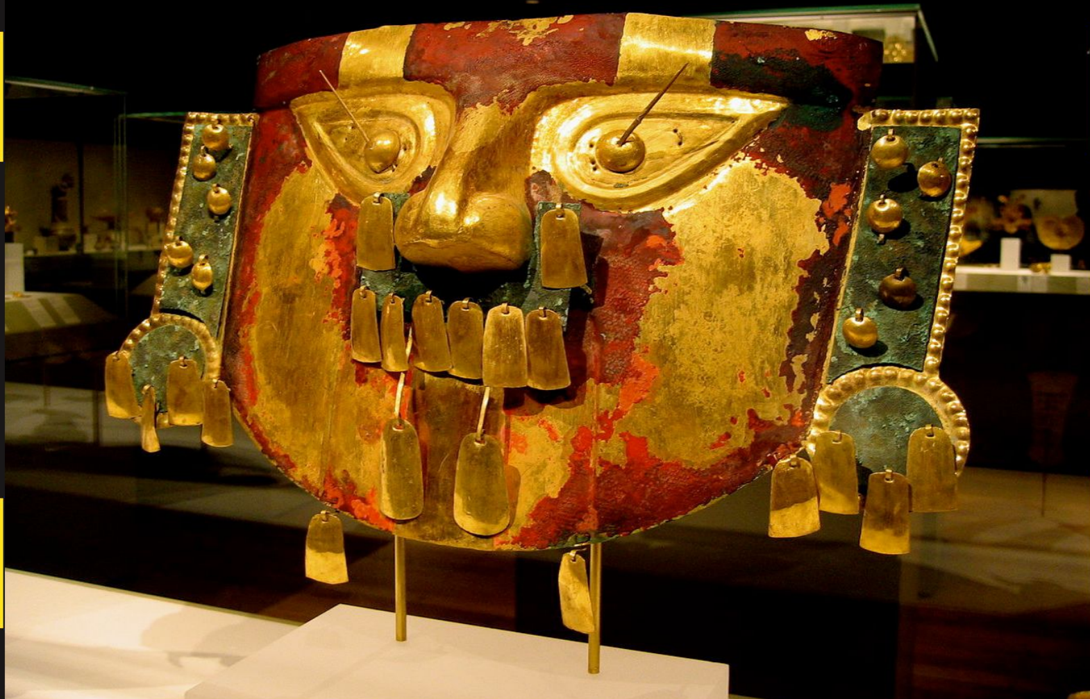
Погребальная маска IX-XI вв, культура Сикан (Перу). Золото, медь, киноварь.