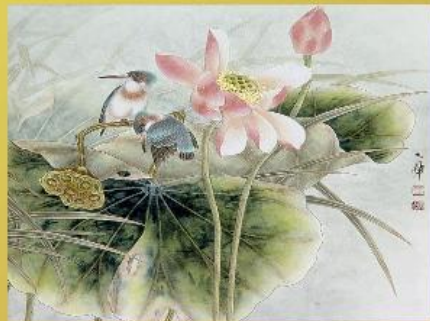
Цветок и птица