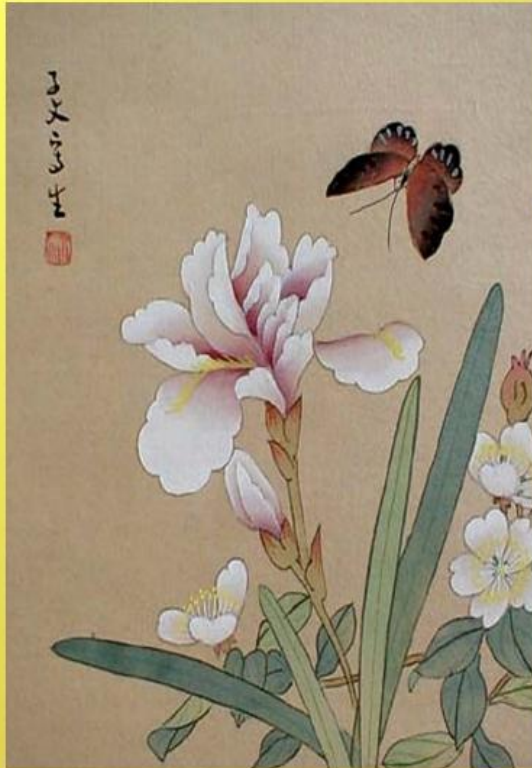
Цветок и бабочка