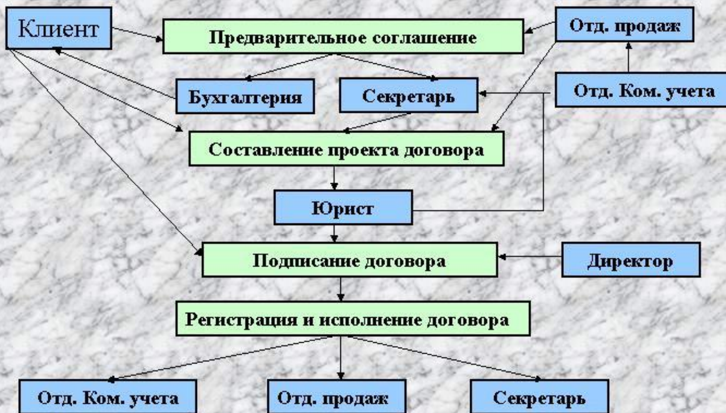
Схема процесса создания и подписания договора поставки