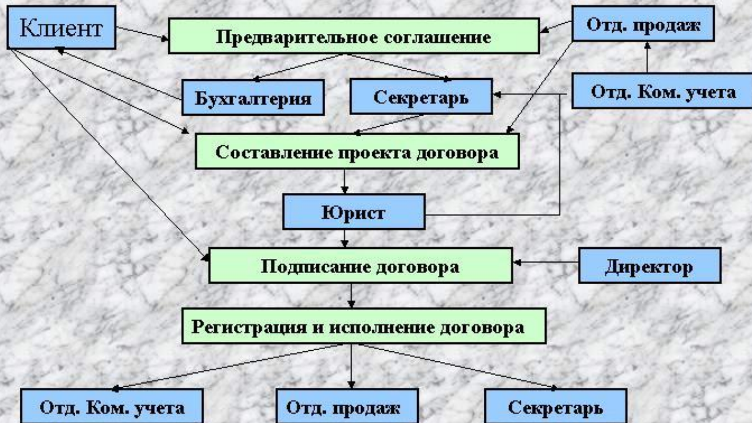
Схема процесса создания и подписания договора поставки