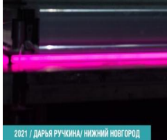
2021 / ДАРЬЯ РУЧКИНА / НИЖНИЙ НОВГОРОД