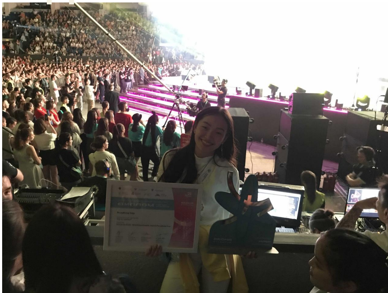
Председатель студенческого клуба и участница хореографического ансамбля «Олчей»