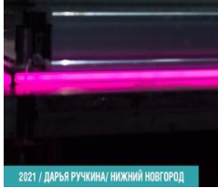
2021 / ДАРЬЯ РУЧКИНА / НИЖНИЙ НОВГОРОД