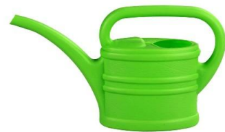
ЛЕЙКА С ВОДОЙ