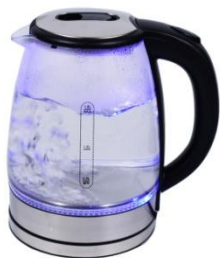
ЧАЙНИК С ВОДОЙ