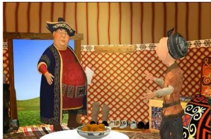
«Хан и баурсаки»