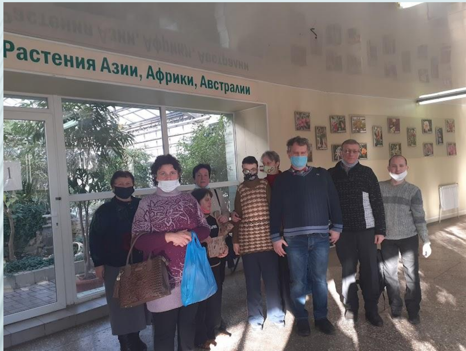
Тактильная экскурсия в ботанический сад