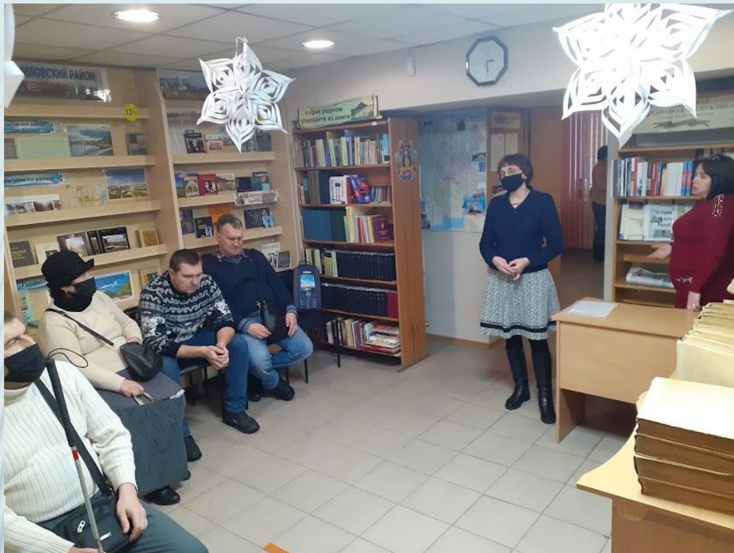
Посещение городской библиотеки