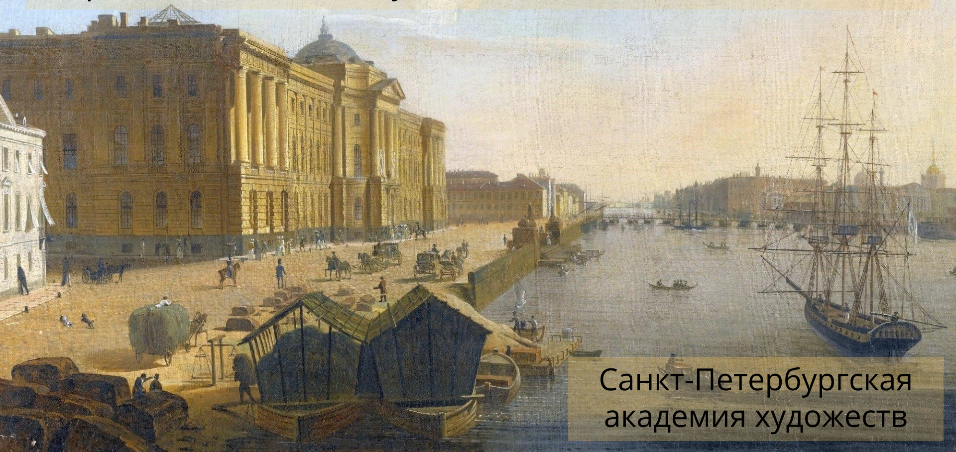
Санкт-Петербургская академия художеств

Кипренский окончил Санкт-Петербургскую академию художеств с золотой медалью в 1803 году и вскоре уехал в Италию, где представил на суд академиков свои работы. Они не поверили, что подобные шедевры мог сотворить Российский художник, обвинив его в том, что он выдает творения знаменитых художников за свои.