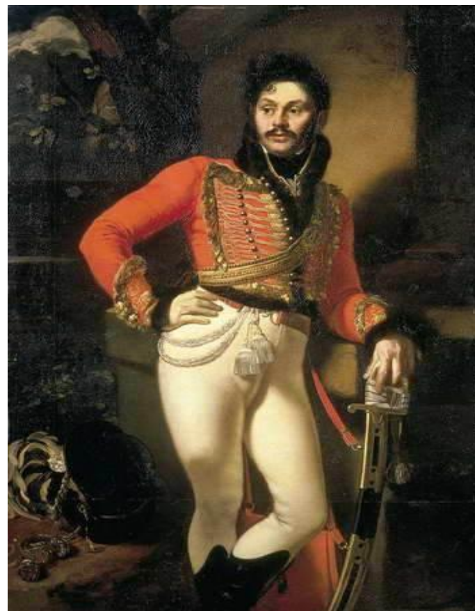
Портрет лейб-гусарского полковника Е. Давыдова (1809 г.)