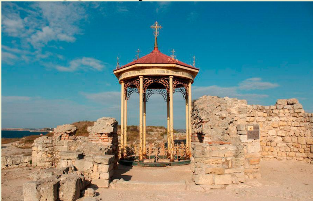
Место крещения Князя Владимира в

Какие аргументы, по мнению Нестора, оказали решающее влияние на выбор веры Владимиром?