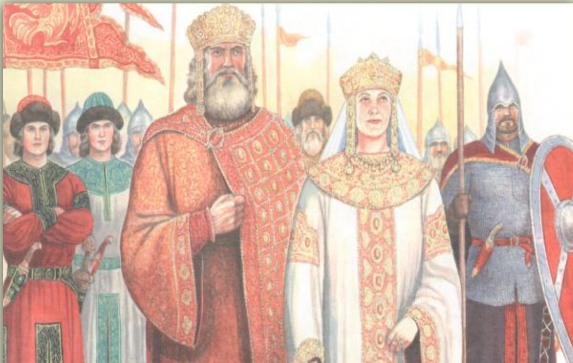
Возвращение Владимира и Анны из Корсуня в Киев