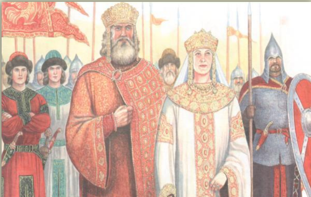
Возвращение Владимира и Анны из Корсуни в Киев